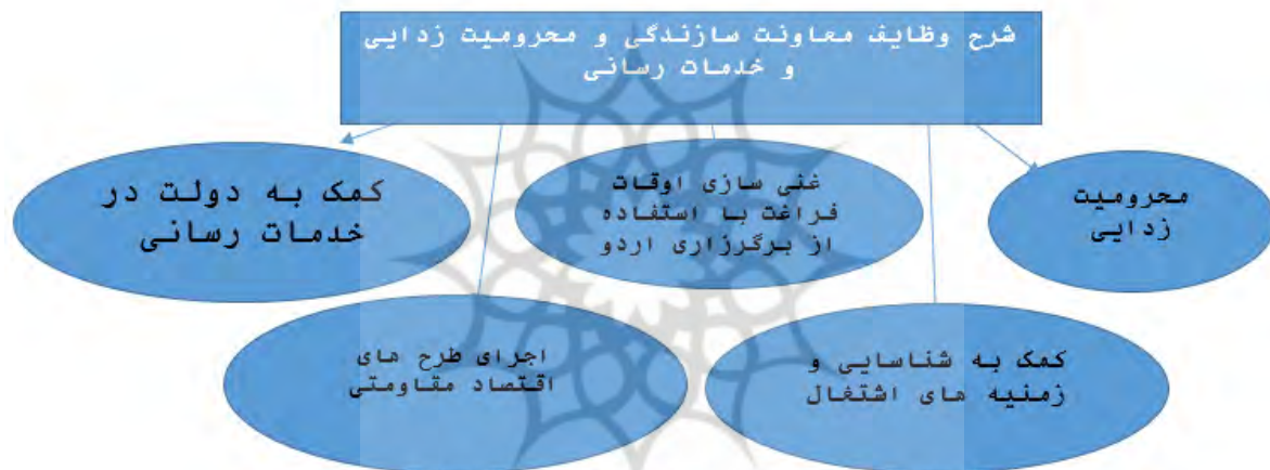
نقش و وظایف بسیج در محرومیت زدایی-بسیج سازندگی، نویسندهگان: ۱۳۹۷

پیچیده، به لحاظ سرزمینی گسترده و بانبروهای با انگیزه است. روش های سنتی در سازمان دهی و بکار گیری بسیج به منظور بهره برداری کامل از این ظرفیت الهی برای انقلاب اسلامی کافی نیست، روش های سنتی در بکارگیری سرمایه های فرهنگی - اسلامی مانع به فعلیت رسیدن این ظرفیت ها برای تغذیه فکری و رفع شبهه های توانمند سازی بسیجیان است، نخبگان باید به طور استراتژیک فکر کنند و برای یافتن مکانیسم هایی به منظور استفاده از شبکه های اجتماعی به نفع امنیت ملی و پیروزی اطلاعاتی تلاش متقاضی انجام دهد (خانیک، ۱۳۹۲: ۴۱۳) طرح سازندگی بسیج به منظور استفاده از نیروهای نشاط و جوانان برای سازندگی کشور در اوقات فراغت به درخواست اینجانب فراهم شده است، بسیج سازندگی خود ش یک شعبه کار عظیم است (طرح بسیج سازندگی با تدبیر مقام معظم رهبری در تاریخ ۷۹/۲/۱۷)