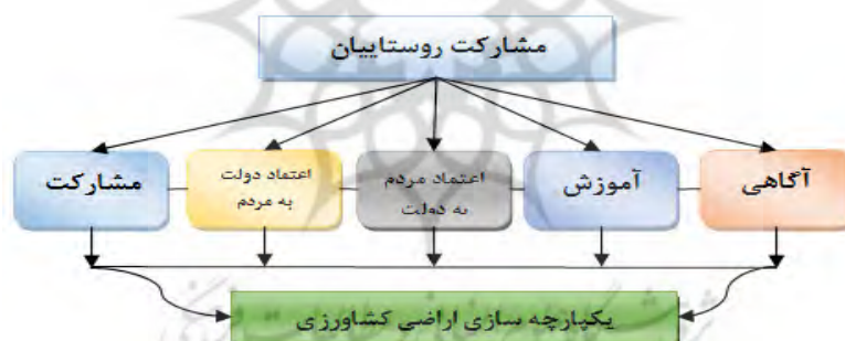
شکل ۱- مدل مفهومی تحقیق

دلایل عدم موفقیت کشاورزی این کشور محسوب می‌شود. تغییر اقتصاد این کشور از مرکز محور به بازار محور منجر به تأثیری عمیق جهت غلبه بر سیستم اقتصادی-اجتماعی و توسعه جامعه دموکراتیک در آلبانی گشته است. با وجود این که بازار هفتگی نقش مهمی در بسترسازی مناسب کشاورزی دارد با این حال، یکی دیگر از ابزار رسیدن به این موفقیت‌ها که مهم‌تر و برجسته‌تر به نظر می‌آید، طرح یکپارچه‌سازی اراضی کشاورزی است. اسکلیکا (۲۰۰۶)، در مقاله خود با عنوان "استفاده از معیارهای ارزیابی برای اثر یکپارچه‌سازی اراضی برای سه منطقه متفاوت مورد مطالعه در جمهوری چک" به این نتیجه دست یافته است که شرایط اولیه اثری قوی بر نتایج برنامه‌های یکپارچه‌سازی اراضی داشته است. تعیین معیار و مدل برای جمهوری چک منجر به بهبود اصول روش شناختی اساسی پروژه شده و آن نیز به فرایندهای تصمیم‌گیری و حمایت در جهت بهینه‌سازی تخصیص منابع مالی محدود کمک خواهد کرد. بورتون (۱۹۸۸)، در مقاله‌ای "یکپارچه‌سازی اراضی زمین در قبرس" به این نتیجه دست یافته است که، یکپارچه‌سازی به عنوان ابزاری قانونی برای اصلاح ساختار کشاورزی قبرس موفقیت چشم‌گیری داشته و تغییرات سریع اقتصادی و اجتماعی حاصل شده است. با این حال، کشورهای دیگر مدیترانه به مطالعه تجربه‌های قبرس در این زمینه رغبت نشان داده‌اند. بنابراین با مطالعه پیشینه تحقیق می‌توان گفت، که در زمینه تحلیل و بررسی نقش مشارکت روستاییان در گرایش به یکپارچه‌سازی اراضی زراعی در شهرستان بستان-آباد مطالعه خاصی صورت نگرفته است و همین نکته نوآوری این تحقیق را نشان می‌دهد.