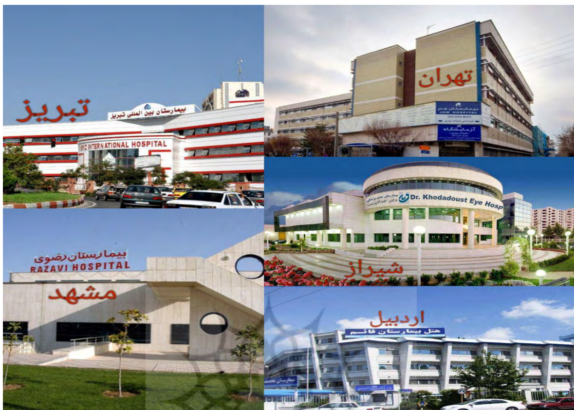
تصویر ۲- بیمارستان‌های گردشگری سلامت و پزشکی