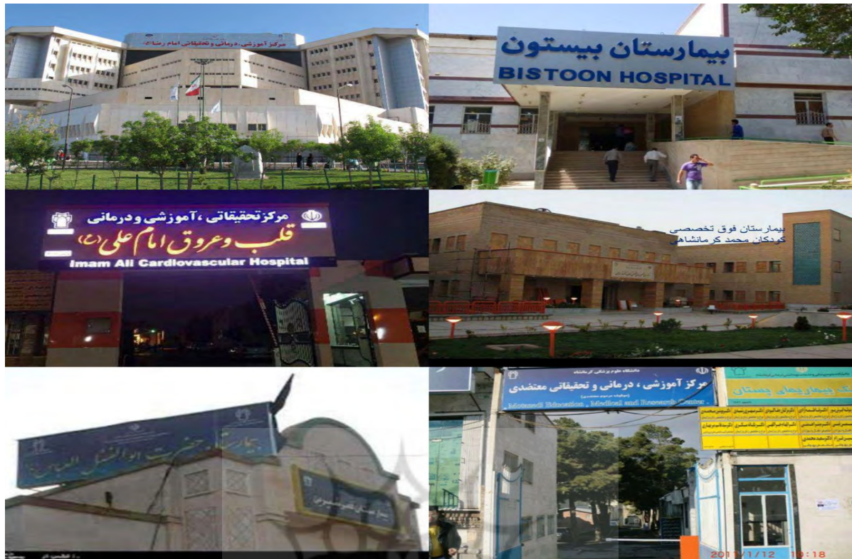
تصویر ۳- بیمارستان‌های گردشگری سلامت و پزشکی استان کرمانشاه

با این حال استان کرمانشاه ظرفیت و قابلیت بالایی در بخش درمانی دارد و می‌تواند به راحتی پذیرای بیماران عراقی و حتی سوری باشد، با تاکید بر این که استان قادر است به نیازهای درمانی مردم عراق، سوریه و حتی قطر پاسخ دهد، حضور بیماران این کشورها در کرمانشاه، هم برای استان سود بخش است و هم خود بیماران هزینه و مسافت کمتری را متحمل می‌شوند. بسیاری از بیماران کشورهای همسایه به دلیل این که آگاهی و شناختی از توانمندی کرمانشاه در بحث درمانی ندارند به استان‌های دیگر مانند تهران، اصفهان، شیراز، مشهد و... سفر می‌کنند؛ در حالی که همان امکانات نیز در این استان وجود دارد. با استقبال سرمایه‌گذاران از حضور در کرمانشاه و سرمایه‌گذاری در بخش پزشکی و درمانی، این گروه‌ها بسیار راغب هستند در بخش گردشگری سلامت در استان سرمایه‌گذاری کنند. با تجهیزات پزشکی نوینی که در بیمارستان‌های کرمانشاه وجود دارد و خواهد داشت؛ بیماران عراقی دیگر نیازی ندارند رنج سفر به سایر استان‌های کشور را به جان خریده و می‌توانند در کرمانشاه به مداوای خود بپردازند. (اسماعیلی، ۱۳۹۵). دفاتر تبلیغات گردشگری سلامت،