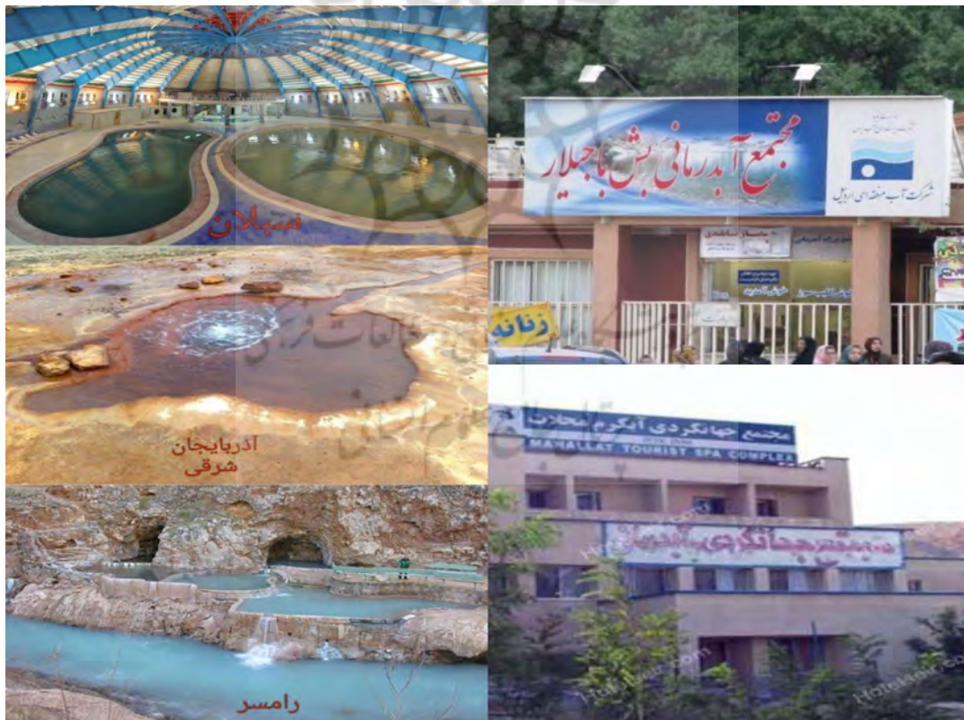
تصویر ۱- نمونه‌هایی از آب گرم‌ها (آب درمانی) در ایران