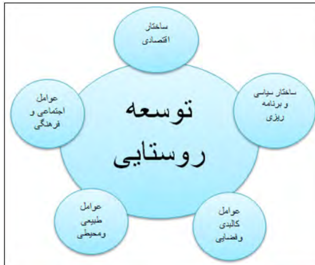
شکل ۱. دیاگرام مدل مفهومی توسعه روستایی