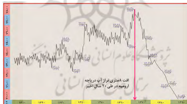
نمودار (۱): روند تغییرات دریاچه ارومیه در قرن اخیر

بررسی‌ها نشان می‌دهد، دریاچه ارومیه نقش مهمی در ابعاد اجتماعی، اقتصادی و زیست‌محیطی، شمال غربی ایران ایفا می‌نماید. ولی در طی چند دهه گذشته با شرایط بحرانی مواجه شده و قسمت‌های زیادی از آن در معرض خشک شدن قرار گرفته است. به طوری که، ولی روند نزولی آن از سال ۱۳۷۴ شروع گردیده و در طی ۲۳ سال، تراز دریاچه بیش از ۸ متر افت کرده است. در واقع با توجه به ارقام ثبت شده، به طور متوسط دریاچه در این بیست سال اخیر سالیانه با افت ۴۰ سانتی متری مواجه بوده است. با توجه به عمق کم این دریاچه، این میزان افت تراز منجر به خشکی درصد قابل ملاحظه‌ای از سطح دریاچه گردیده و بیش از ۳۰ میلیارد متر معکب از حجم آب آن در اثر تبخیر و عدم ورود منابع آب کافی به آن، از بین رفته است (نمودار ۱) (ستاد احیای دریاچه ارومیه، ۱۳۹۴: ۱۱).