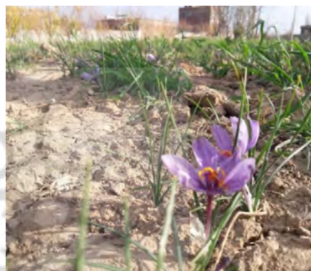
تصویر (۱): تغییر الگوی کشت در روستای قیچاق با کشت زعفران