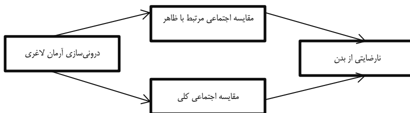
شکل ۱. الگوی پیشنهادی پژوهش حاضر

به‌عنوان میانجی رابطه بین درونی‌سازی آرمان لاغری و نارضایتی از بدن در دانشجویان دختر مورد بررسی قرار گرفت. شکل ۱ الگوی پیشنهادی پژوهش حاضر را نشان می‌دهد.