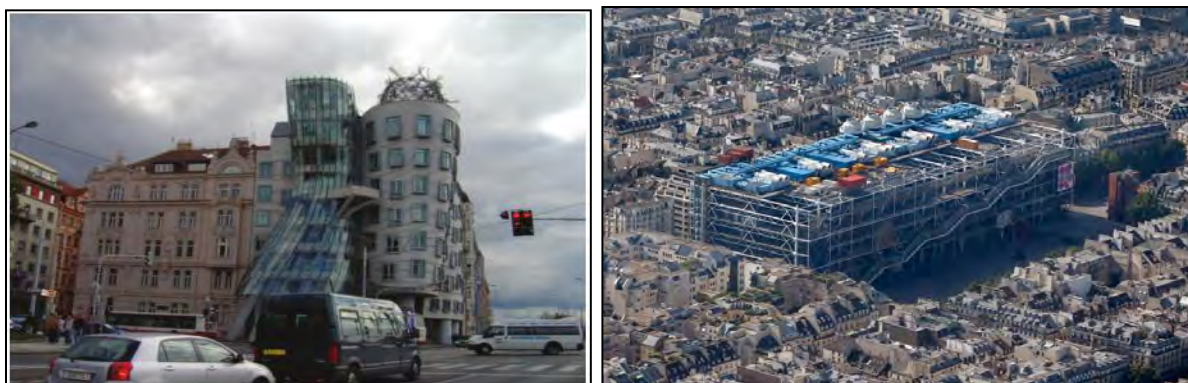
شکل ۱- مرکز فرهنگی ژرژ پمپیدو در قلب پاریس (سمت راست)، ساختمان نمادین در حال رقص (سمت چپ)