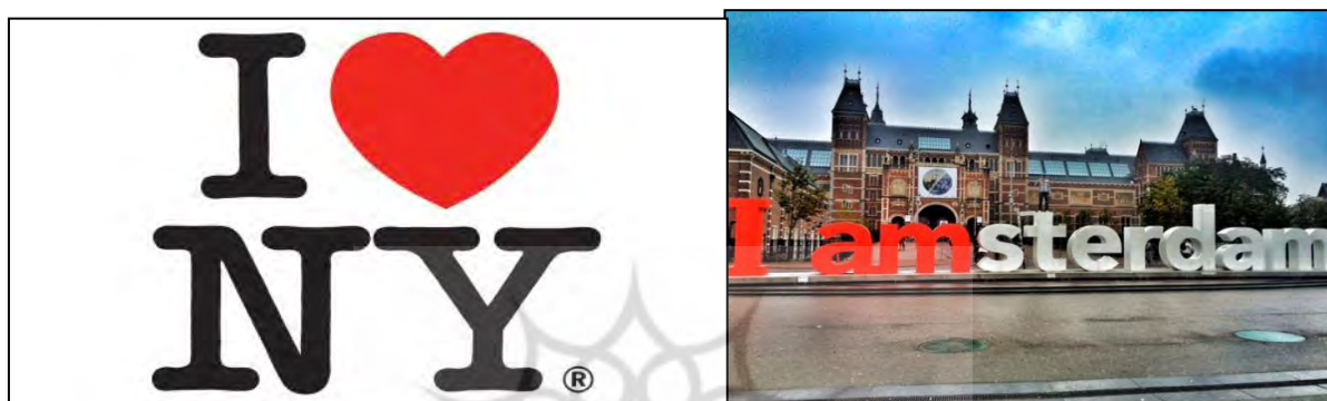
شکل ۲- شعار تبلیغاتی دو شهر نیویورک (سمت چپ) و آمستردام (سمت راست)