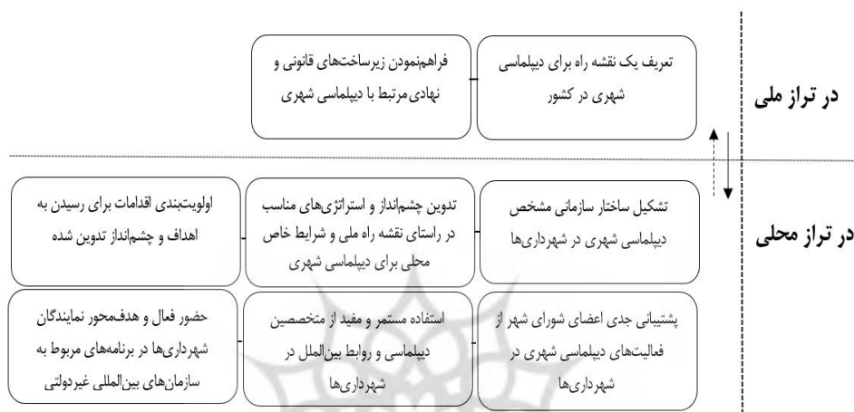
شکل ۳- پیشنهادها برای ایجاد تغییر در رویه‌های موجود و تقویت دیپلماسی شهری در کشور

تعریف یک نقشه راه برای دیپلماسی شهری در تراز ملی و فراهم کردن زیرساخت‌های قانونی و نهادی آن به همراه اقداماتی که در تراز محلی باید انجام شود، و آموختن از رویکردها و تجارب در دیگر شهرهای جهان در سایه اقدامات پیشنهاد نخست. (شکل ۳).