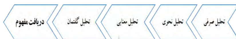
شکل ۳: مراحل پردازش و تحلیل متن

خروجی این مرحله، متنی منظم و برچسب‌گذاری شده موسوم به پیکره متنی است. ۲. پردازش متن با استفاده از داده‌های آموزشی (Training): در این مرحله با استفاده از الگوریتم‌های داده‌کاوی، داده‌های آماده‌سازی شده پردازش و الگوهای مرتبط بر پایه کلمات کلیدی استخراج می‌شود. ۳. تحلیل متن: در این مرحله خروجی مرحله قبل مورد آزمایش قرار می‌گیرد. الگوهای به‌دست‌آمده در مرحله قبل روی بقیه متن اعمال شده و مشخص می‌شود آیا دانش جدیدی از متن قابل استخراج است یا خیر.