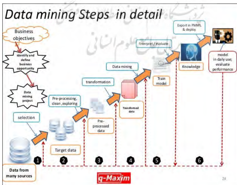
شکل ۹ - گام‌های مختلف برای تحلیل و استخراج دانش از