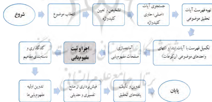
شکل ۱: نمودار اجرای مراحل مختلف تحقیق موضوعی در قرآن کریم

داده‌کاوی فرایندی چندمرحله‌ای است که به کشف دانش از داده‌ها منتهی می‌شود. مهم‌ترین مرحله در این فرایند آماده‌سازی داده‌ها (Data preparing) است. بسیاری