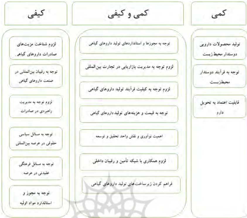
شکل ۳- نمایش مشترک داده‌های کمی و کیفی

طبق گام‌های روش تحقیق کیفی، از جمله مصاحبه با خبرگان و کدگذاری تلاش گردید که مهم‌ترین الزامات رقابتی تولید داروهای گیاهی برای حضور در عرصه بین‌المللی ارائه شود و طبق گام‌های روش تحقیق کمی، از جمله پرسشنامه و تحلیل اهمیت-عملکرد مهم‌ترین اولویت‌های رقابتی تولید رتبه‌بندی شد که این اولویت‌بندی به صورت جدول ۸ نمایش داده شده است.