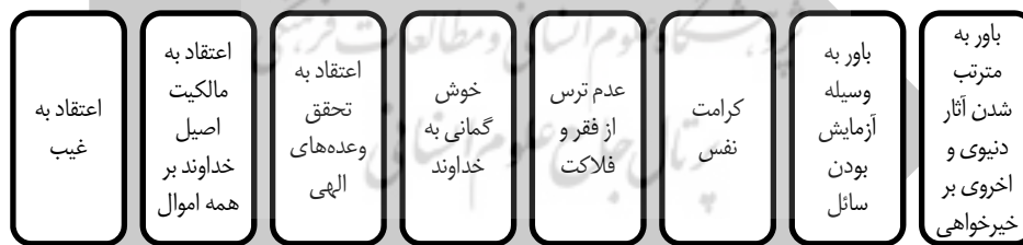
شکل ۲: براداری از ویژگی‌های مربوط به اعتقادات و اخلاقیات خیرین (A)

۱-۱. گروه اول: براداری از ویژگی‌های مربوط به اعتقادات و اخلاقیات خیرین (A)