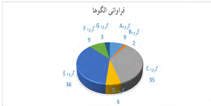
نمودار ۲: فراوانی الگوها chart 2: Frequency of patterns