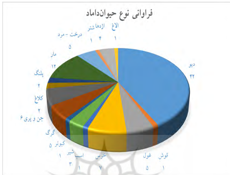
نمودار ۱: فراوانی انواع حیوان داماد