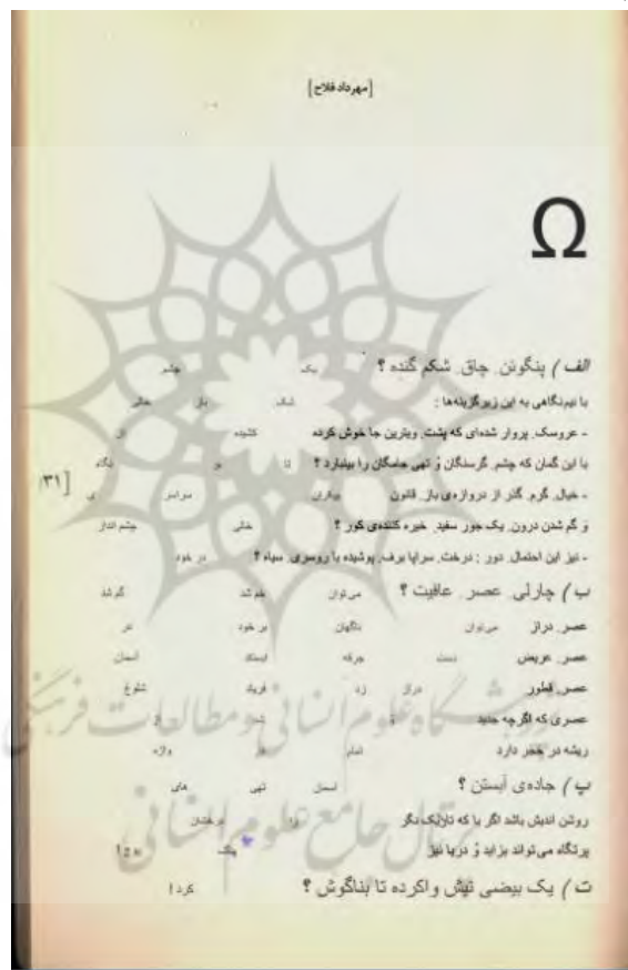
شکل ۳. شعر Ω

برای نمونه در این شعر فلاح از مجموعه چهارجوابی‌ها، همان نظم فضایی پیش‌گفته را می‌بینیم: