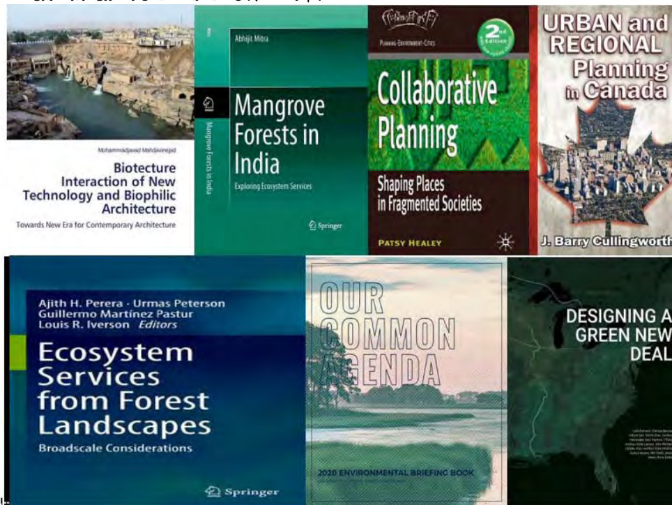
شکل ۱) منتخبی از مهم‌ترین منابع شکل‌دهنده و پشتیبانی‌کننده چارچوب مفهومی