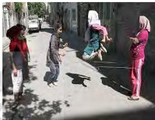
شکل ۵) کودکان و فضای شهری

با توجه به تراکم بالای جمعیتی و کالبدی نواحی منطقه ۱۰، کودکان به‌عنوان یکی از گروه‌های هدف که نیازمند ارتقای کیفیت محیطی هستند شناخته می‌شوند. چنانچه در سال ۹۱، سازمان مردمنهاد «نیک‌آوران» به همراه بنیاد باهمستان و دفتر نوسازی محله سلسبیل جنوبی، به دنبال حل یکی از مسئله‌دارترین مناطق تهران، یک روز به‌عنوان کوچه بهتر از لحاظ کالبدی-اجتماعی و با محوریت حق کودک در شهر تبدیل کردند. ریشه‌یابی این مشکل با جلسات ۳ ماهه گروه‌های محلی برای شناسایی و ریشه‌یابی مسایل و مشکلات محله به‌صورت خاص محدوده موردنظر این پروژه صورت گرفت تا گروه‌های محلی مشارکت‌کننده از طیف زنان خود اشتغال، کودکان، نوجوانان و سالمندان، مخاطب این طرح باشند (شکل ۵).