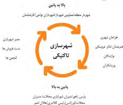
شکل ۴) برنامه مشارکت جشنواره بازی‌های خیابانی منطقه ۱۰ تهران

آزمون و ارزیابی رویداد براساس داده‌های گردآوری شده توسط پژوهشگران به‌صورت مشاهده مشارکتی و مصاحبه‌های نیمه‌ساختاریافته با ۱۳ کارشناس از مدیریت شهری چون حوزه اجتماعی، ترافیک، خدمات شهری، محیط‌زیست، پلیس راهور، آتش‌نشانی، هلال‌احمر، اورژانس، شوراییاری محلات، مدیران محلات و ۱۵ نفر از والدین شرکت‌کننده (۱۰ نفر زن و ۵ نفر مرد) انجام شد. سئوالات در مورد مناسب‌بودن مکان، زمان، تجهیزات لازم و رضایتمندی از رویداد و تجربه حضور و پیشنهادها برای رویدادهای آتی را به خود اختصاص دادند. مصاحبه‌ها بازه زمانی در حدود ۱۰ تا ۱۵ دقیقه به طول انجامید. تمامی مصاحبه‌ها با اجازه مشارکت‌کنندگان ضبط و پیاده‌سازی شد. تحلیل داده‌ها نیز به روش «تحلیل محتوای کیفی و کمی» در ارزیابی به کار گرفته شد [23, 24]. از نتایج مصاحبه‌های نیمه‌ساختاریافته به‌عنوان ابزار برای سه سوگیری و اعتبارسنجی پژوهش کیفی در کنار مشاهده مشارکتی استفاده شده است.