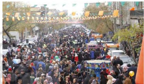
شکل ۶) اولین جشنواره «خیابان در دست بچه‌هاست»، خیابان رودکی منطقه ۱۰ تهران، آذرماه ۱۳۹۶

در کنار تامین وسایل بازی مناسب، حضور دست‌فروشان، مغازه‌های مختلط با تامین نیازهای روزمره زندگی همراه با آسایش اقلیمی و پاکیزگی هوای محدوده از زیرساخت‌های لازم برای تحقق رویداد در طرح‌های شهرسازی تاکتیکی محسوب می‌شوند. حضور گروه‌های مختلف هنری به‌ویژه برنامه‌های موسیقی سرگرم‌کننده از عوامل جذابیت محیطی به شمار می‌آید. بررسی نمونه‌های انجام‌شده در این منطقه گواه بر طراحی و تمهید فضاهای مجزا و مستقل به گروه دست‌فروشان، وسایل بازی نمایشگاه‌ها و برنامه‌های هنری و موسیقی است تا امکان بهتر همه گروه‌های مختلف اجتماعی مانند زنان، سالمندان و کودکان در اختلاطی مؤثرتر فراهم شود و ترجیحات محیطی هرکدام از این گروه‌ها سنجیده شود (شکل ۶).