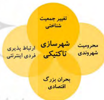
شکل ۱) عوامل ظهور شهرسازی تاکتیکی [9]

و فرآیند متحول می‌کند. ویژگی طراحی یک «مکان» هرگز به‌خودی‌خود یک هدف نیست. «کافه‌های خودکار» (Pop-Up Cafes) طراحی به‌عنوان شریک را در اختیار می‌گیرند و حتی بعد از آن، فراهم‌کنندگان آنها فقط ساکنان محلات هستند. این فضاها که مردم آنها را بدون کمک می‌سازند و به نظر می‌رسد بخش قابل‌توجهی از دلبستگی آنها به این فضاهای شهری جدید شکل می‌گیرد. این فرآیند نقش مهمی بازی می‌کند و این امر رخ می‌دهد چرا که طراحی شهری با توجه به اینکه اغلب مردم با یکدیگر هماهنگ می‌شوند و خودشان را از طریق ساختارهای دیگری که جهت اهداف متفاوت خلق شده‌اند سازمان‌دهی می‌کنند، مرتبط می‌شود تا به راه‌حل‌های طراحی شهری دست یابد. (این جمله نامفهوم است و بایستی بازنویسی شود) در این بستر، فعالیت جامعه مدنی نقشی اساسی در ابتکارات تاکتیکی که ساکنین و نقش‌آفرینان محلی را نیز مشارکت می‌دهد، ایفا می‌نماید. در اکثر این فعالیت‌ها، اقدامات تاکتیکی اغلب بر پایه استفاده مجدد از اشیاء از پیش موجود است (مانند بیمارانی از صندلی). در عوض طراحی روی فرآیند و مفهوم، تمرکز بیشتری پیدا می‌کند. استفاده از منابع کمیاب احتمالاً یکی از موضوعات کلیدی است که به اقدامات تاکتیکی اجازه می‌دهد تا مستقل و نامشخص باقی بمانند [3, 9, 11] .