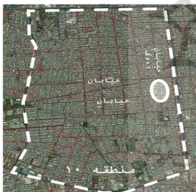
شکل ۳) جایگاه خیابان رودکی در شهر منطقه ۱۰

با این ویژگی‌ها شهرداری منطقه ۱۰ تصمیم گرفت که اولین جشنواره بازی‌های خیابانی را در بخشی از این خیابان حفاصل خیابان مرتضوی و خیابان امام‌خیمینی برگزار نماید. بدین منظور روز میلاد پیامبراکرم (ص) انتخاب شد. همه اقدامات و هماهنگی‌ها بسیار سریع اتفاق افتاد. ابتدا کمیته تصمیم‌گیری تشکیل شد. اعضای این کمیته‌ها علاوه بر شهردار منطقه که در رأس آن قرار می‌گرفت، معاونین وی که در حوزه‌های خدمات شهری و محیط‌زیست، اجتماعی و فرهنگی، حمل‌ونقل و ترافیک و نیز شهرداران نواحی ۳ گانه و نماینده دبیر شوراییاری محلات ۱۰ گانه تشکیل می‌داد (شکل ۴). هر یک از اعضای کمیته علاوه بر ارایه پیشنهاد وظایفی را عهده‌دار شدند. از مهم‌ترین اقدامات رایزنی با پلیس راهور و کلانتری بود که می‌بایست در بسته‌شدن خیابان به روی ترافیک سواره همکاری لازم را می‌داشتند. در برپایی جشنواره، دبیران شوراییاری محلات و مدیران محلات نقش بسیار پررنگی را ایفا نمودند؛ همچنین مدیر شهرداری منطقه که مشارکت قابل‌توجهی در ارایه خدمات بازی برای بچه‌ها داشت مسئولین هلال‌احمر، اورژانس و پلیس راهور با حضور دایمی در محل اطمینان خاطر ساکنین را در برقرار امنیت فراهم آورده بودند. تمامی خدمات به‌صورت رایگان انجام شد.