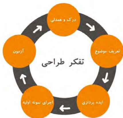
شکل ۲) فرایند تفکر طراحی

تامین منابع سرمایه‌گذاری؛ مجوزهای قانونی؛ مصالح اولیه). ۵- آزمون: تدوین فرایند ساخت، اجرا، یادگیری برای استفاده مناسب [1,9,17].