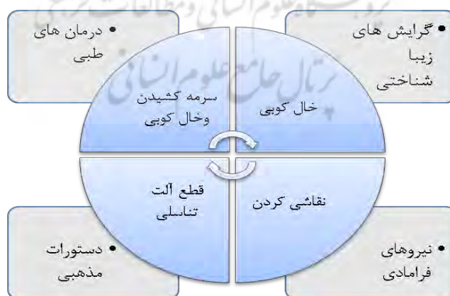
شکل ۴. عناصر هم‌فراخوان دست‌کاری بدن در دوران پیشامدرن

در بینش هستی‌شناسانه حاکم بر دوران پیشامدرن، نیروهای فرامادی و عوامل اجتماعی و گروهی، مهم‌ترین دلایل معنابخش درزمینه آرایش، اصلاح و تغییر در اعضای بدن به شمار می‌روند. گرایش‌های زیباشناختی، درمان‌های طبی، نیروهای فرامادی، دستورهای مذهبی و مجازات و تنبیهات قانونی نیز از عوامل مهم ایجاد جرح و تعدیل در بدن و تغییر و اصلاح اندام‌های جسمانی به حساب می‌آیند؛ برای بهبودیافتن از بیماری‌ای که به پندارشان در اثر چشم‌زخم پدید آمده و نیز برای دورماندن از چشم بد نیز «خال» می‌کوبیدند (کتیرایی، ۱۳۷۸: ۴۱۴). خال‌کوبی خصلت جادویی می‌یابد و به نیروهای فرامادی پیوند می‌خورد. ولی از بین تمامی این عوامل، ارضای حس زیباشناختی رایج‌ترین و مرسوم‌ترین عاملی شناخته می‌شود که کنشگران اجتماعی را ترغیب می‌کند که این اصلاحات و دگرگونی‌ها را بر سیمای ظاهری بدن‌های خود اعمال کنند. آرایش چهره و گیسوان، حناکردن، خضاب‌کردن، خال‌کوبی، سوراخ‌کردن و نقاشی‌کردن، آشناترین سازوکارهای موجود برای زیباساختن بدن در این دوران محسوب می‌شوند. سرمه‌کشیدن نیز علاوه بر زیباترکردن چهره، جهت درمان بیماری‌های چشمی بسیار مورد توجه عموم بوده است. به عبارت دیگر، می‌توان گفت بازنمایی و آرایش بدن اعتبار خود را از ارزش‌ها و باورهای جمع می‌گیرد. نوع خال‌کوبی و اشکال خال‌کوبی تا حد زیادی در ارتباط با مشخصه‌های گروهی یا جنسی فرد تعیین می‌شود؛ بدین ترتیب، «داش‌ها و مشهدی‌ها، گاه آیه قرآن به بازوی خود خال‌کوبی می‌کنند» (کتیرایی، ۱۳۷۸: ۴۱۵). در این دوران، مرزهای جنسیتی قابل تفکیک است و استفاده از لوازم آرایش، خاص گروهی از افراد بود. همه افراد نمی‌توانستند چنین کارهایی انجام دهند، چراکه جبر و فشار اجتماعی اجازه چنین کاری را به آن‌ها نمی‌داد.