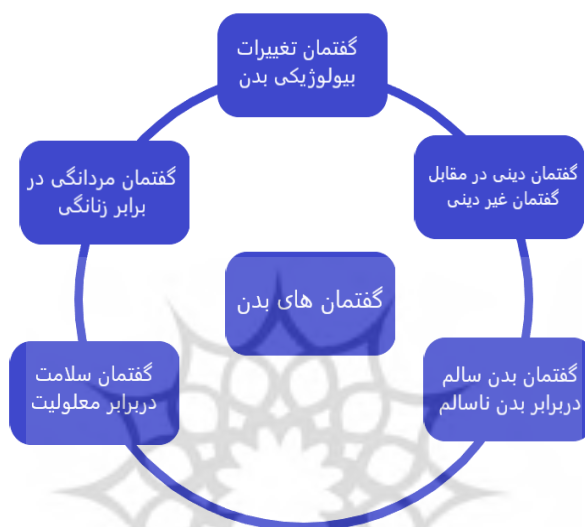
شکل ۱. گفتمان‌های بدن

ث. گفتمان سلامت در برابر معلولیت: موضوع این گفتمان، نشان دادن تلاش افراد ناتوان و معلول برای به کارگیری منابع گفتمانی خود است تا به کمک آن با تجربه‌ای که از بدن خود و دیگران دارند، کنار آمده، آن را معنا ببخشند و فهم کنند.