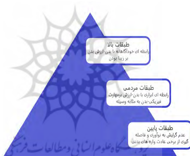
شکل ۲. رابطه هم‌فراخوان طبقات اجتماعی و عادت‌واره‌های بدنی

آن چیزی که در عادت‌واره‌های بدنی طبقات پایین جامعه مهم است، هم‌نوابودن با هنجارهای زیبایی و نوآوری است. آن‌ها اسیر بازتولید عادت‌واره‌های بدنی خودشان هستند. تحصیلات پایین در این طبقات و گرایش نداشتن به بازارهای شغلی، جایی برای بازنمایی بدنی نمی‌گذارد. به نظر می‌رسد چندان توجهی به موقعیت جامعه‌ای ندارند که در آن یگانه شکل تداوم، اشکال موقت است و پیش‌بینی‌ناشده‌ها اغلب بر آنچه محتمل است، سبقت می‌گیرند. براساس آنچه بیان شد، افراد هرچقدر از نردبان سلسله‌مراتب و پایگاه اجتماعی پایین‌تر می‌آیند، به همان اندازه از عادت‌واره‌های بدنی فاصله گرفته و کمتر به سمت دست‌کاری و بازنمایی آن می‌روند و بالعکس (بورديو، ۱۹۷۹: ۲۱۰).