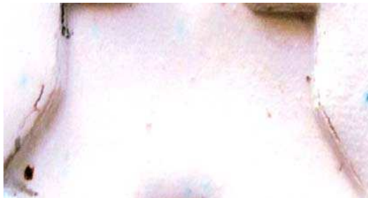
تصویر ۴. نتایج آزمون رنگ زرد ب در دمای ۵۰۰.