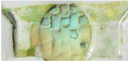
تصویر ۲. نتایج آزمون رنگ زرد الف در دمای ۵۸۰.