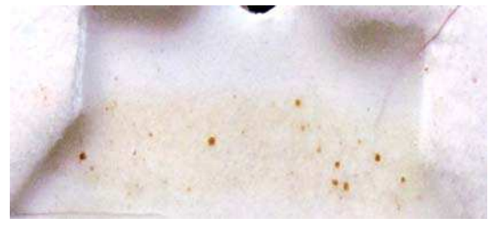
تصویر ۱. نتایج آزمون رنگ زرد الف در دمای ۵۰۰.