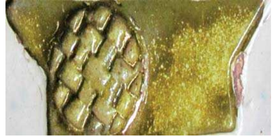
تصویر ۶. نتایج آزمون رنگ زرد ب در دمای ۵۸۰. مأخذ: همان.

نحاس محرق به کبریت زرد (گوگرد) نیشابوری از نحاس محرق به گوگرد، با نام مس سوخته نیز یاد می‌کند و معتقد به رکن بزرگ بودن این ماده در میناکاری و کاشیکاری است (جوهری نیشابوری، ۱۳۸۳، ۳۲۱). در بخش چهارم کتاب مذکور به سوزاندن مس با گوگرد جهت ساختن نحاس محرق به گوگرد اشاره می‌کند (همان، ۳۵۴-۳۵۷). در این روش از اختلاط مس با گوگرد، سولفید مس ( Cu_2S ) حاصل می‌شود. همانگونه که ذکر شد نحاس محرق ترکیبی از مس و گوگرد است که در صنعت با عنوان سولفید مس عرضه می‌شود. روی سختج، روی سوخته (بیرونی، ۱۳۵۸، ۶۸۹)، روسختج، راسخت، راسخ، روسوخته، (دهخدا، ۱۳۷۷، ۲۲۳۶۵)، روسخ تاج و روسوخته (رازی، ۱۳۷۱، ۵۲۲) از دیگر نام‌های سولفید مس در گذشته است.