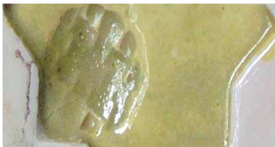
تصویر ۵. نتایج آزمون رنگ زرد ب در دمای ۵۵۰، مأخذ: همان.