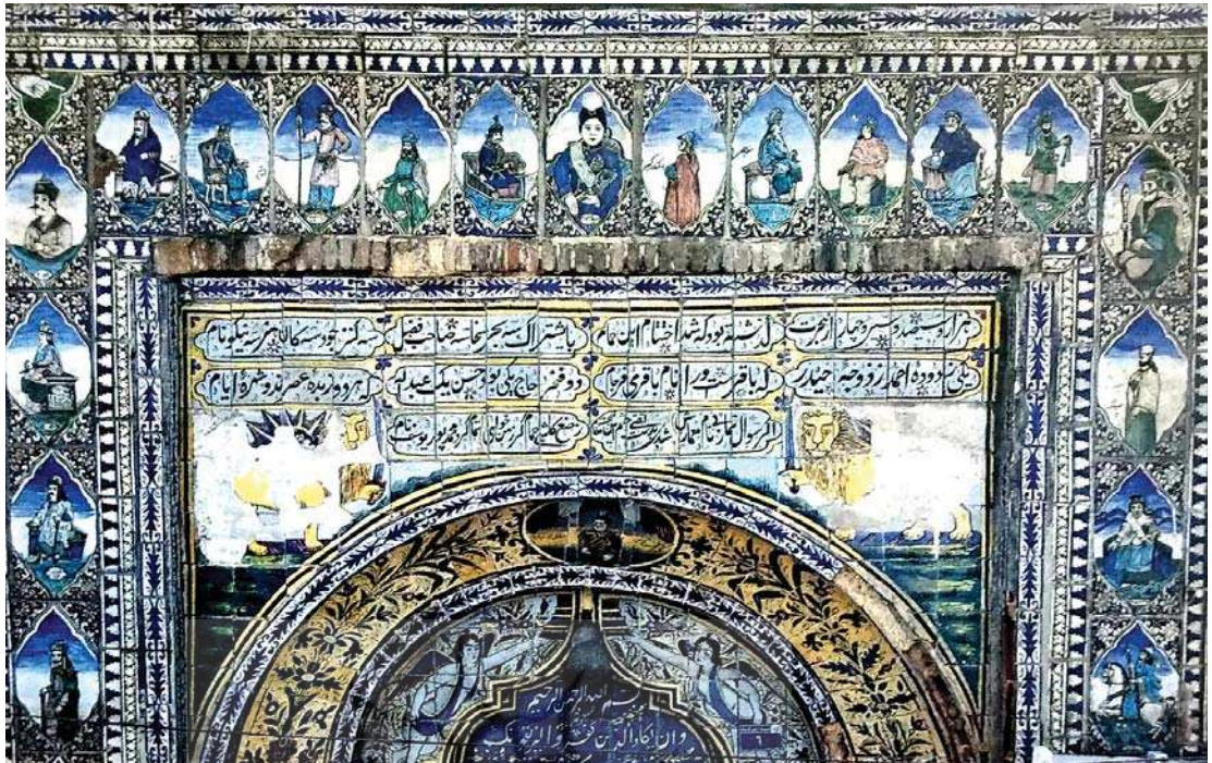
تصویر ۱۰. نقش ملانک، شیر و خورشید، سلاطین و خوشنویسی، رقم محمدپور یوسف نام، بدون تاریخ، ۱۳۳۴ ه ق، اندازه: ۲۸۰×۲۶۰، مکان: سردرحمام گلزار، رشت. مأخذ: همان.

فراگیر و جذاب بودن این مضامین در بازارهای اصفهان و نقل جیمز موریه از این تصاویر اشاره می‌کند. در بسیاری از جای‌ها نقاشی و آرایه‌ها و پیکرهایی (به‌ویژه زیر گنبدهای میان بازارها) از قهرمانان کشور یا جنگ‌ها یا پیکره‌های جانوران و چیزهای دیگر دیده می‌شوند. ۲ (فلور، ۱۳۹۵: ۱۳۳۲) فلور به نقل باکینگم از بازارهای جدید شیراز در نقوش افسانه‌ای و اساطیری دیوها با شاهان اشاره می‌کند و در نقل هم‌زمانی شاهان در رویارویی با دشمنان دیوانگاران، «بسیاری از آن‌ها را دیوها و جانوران عجیب الخلقه محیرالعقلی می‌داند که اینجا واقعیت یافته و خیل جمعیت را به خود واداشته. تمثال نادرشاه، شاه‌عباس و فتحعلی‌شاه جایی در آن میان دارند که یا درگیر نبرد یا ناظر بر قتل عام‌های سبعانه‌اند.» (همان، ۱۳۳)