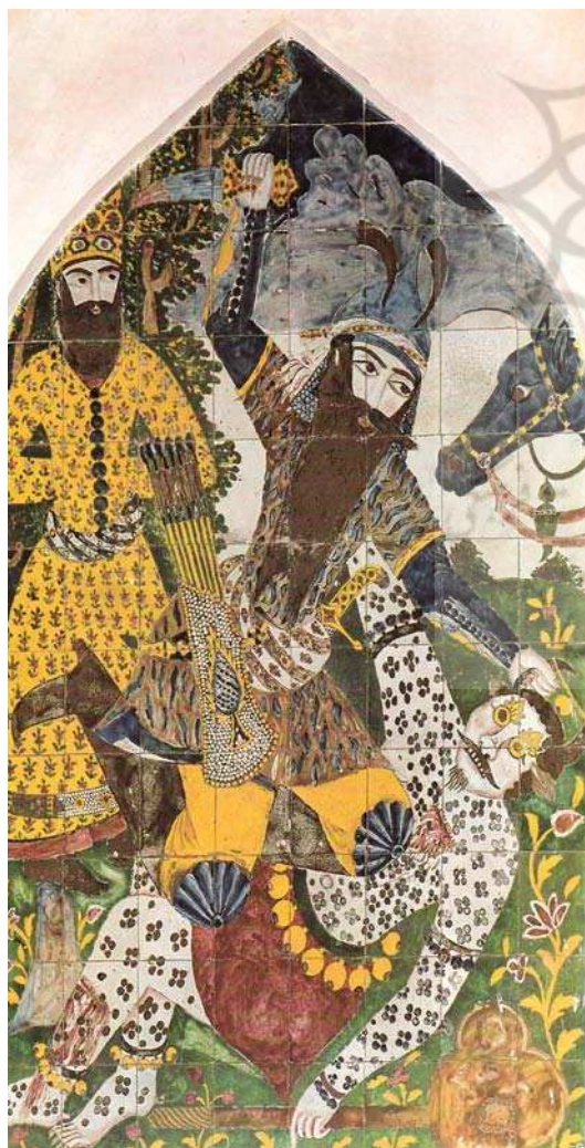
تصویر ۶. جنگ رستم و دیوسپید، عمل آقامیرزا عبدالله نقاش، ۱۲۲۰ هـ. ق، حمام قدیمی ملایر. مأخذ: سیف، ۱۳۹۲.

در نسبت دانی خاندان خود با صفویان و تمجید از افتخارات جنگاوری افشاریان و پیش از آن ترکمانان آق قویونلو و نمود تصویری آن در امر به اجرای دیوارنگاری جنگ چالدران و نبرد کرنال نادر و ستایش جنگاوری‌های آنان پدیدار می‌شود. بدین سبب فتحعلی شاه را باید میراث‌دار سنتی دانست که با اندیشه‌های سیاسی حکومتی پیوسته از دوران پیشین آشنا بوده و بر آن تأکید داشته است. همراهی او در یکپارچگی سیاسی کشور با آغامحمدخان لزوم حفظ وحدت ملی همراه با اتحاد مذهبی و سیاسی را در اندیشه او پروراند و نظر به تثبیت خود در امتداد خط سیر پادشاهی ایران به ثبت شناسنامه تصویری از خود و خاندان قاجار با توسل به الگوهای تصویری و عناصر قهرمانی و ملی پرداخت.