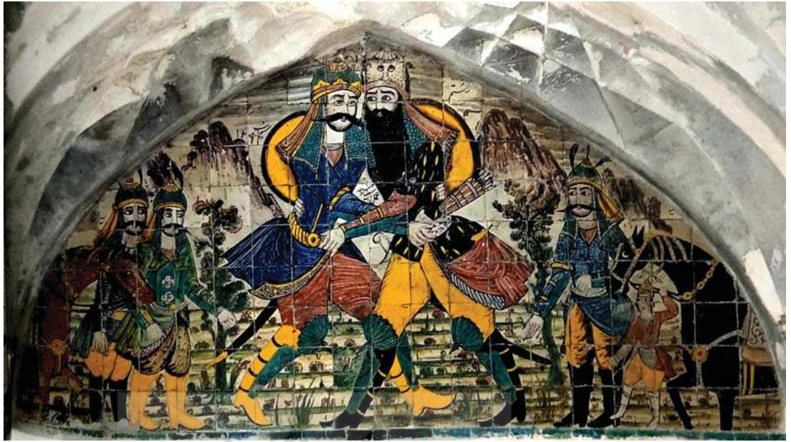
تصویر ۱۴. نبرد رستم و سهراب، عمل استاد حیدر، بدون تاریخ، منسوب به نیمه اول قرن ۱۳ ه ق، اندازه: ۲۰×۲۲، مکان: حمام قدیمی وزیر، کرمان. مأخذ: همان.