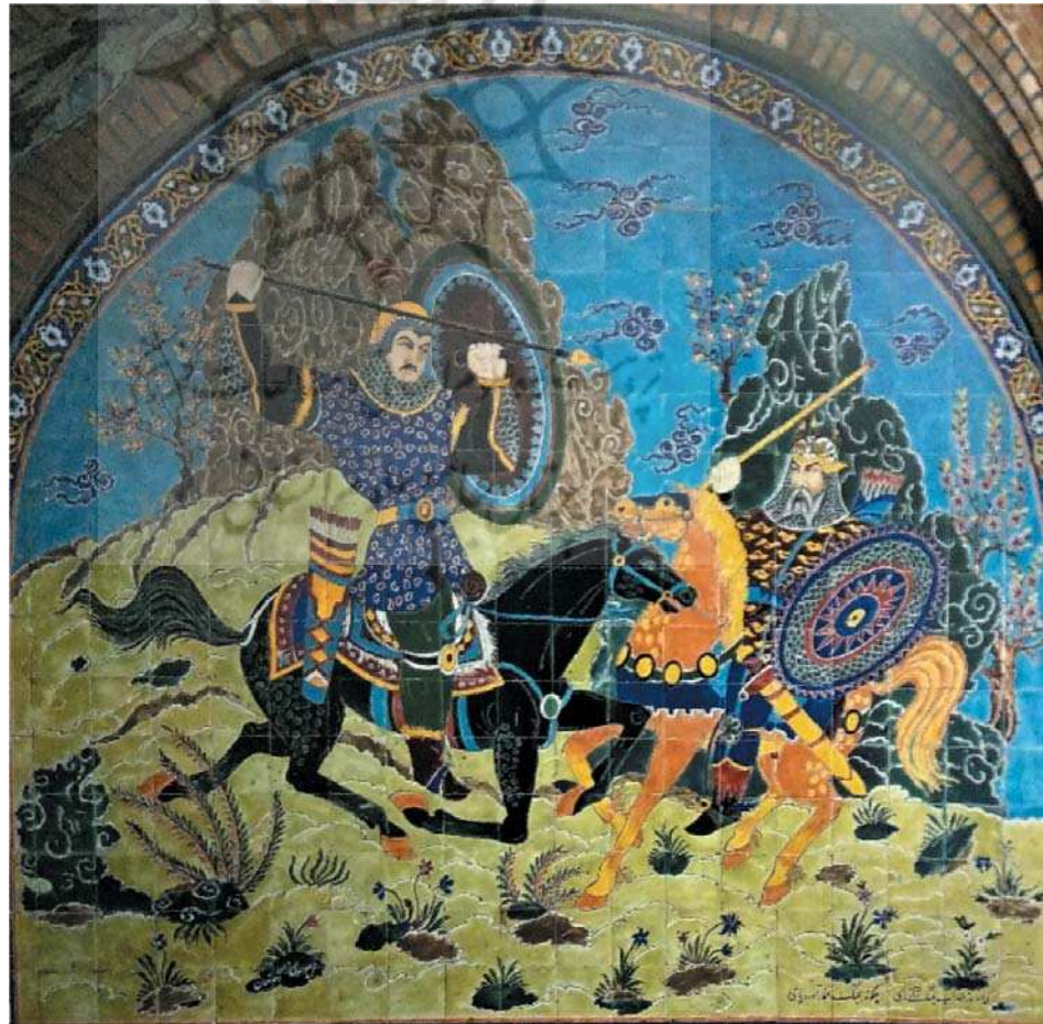
تصویر ۱۵. نبرد رستم و سهراب، بدون رقم، منسوب به موسوی زاده کاشی نگار اصفهانی، بدون تاریخ، منسوب به نیمه دوم قرن ۱۴ ه ق، اندازه: ۲۸۰×۴۲۰، مکان: حمام قدیمی در باغ عقیف آباد، شیراز. مأخذ: همان.