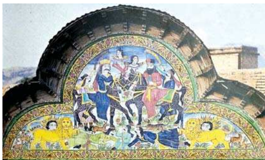
تصویر ۸. نقش سربازان به تقلید از حجاری‌های تخت جمشید، بدون رقم، منسوب به نیمه دوم قرن ۱۳ ه.ق، اندازه: ۸۰×۶۰، مکان: سراسرای ورودی کاخ گلستان، تهران. مأخذ: همان.

که این شبیه را به وجود می‌آورد. دلیل این شبیه دقت در جزئیات این تصاویر، در تقابل با ساده‌سازی‌های تصویری برخی دیوارنگاره‌های عامه است که به نظر محصول عوامل اقتصادی و سیاسی است؛ اما آنچه این تصاویر مکان‌های عمومی را به‌عنوان بازتابی از اندیشه‌های ملی و ایران‌شهری قرار می‌دهد، نه صرف شیوه‌های پردازش اجرا، بل تکرار شاه آرمانی با بازنمایی خیالین رستم، با شمشیری مرصع و در حال کشتن دیو سپید است. (مقایسه تصویر ۳، ۴ و ۵ با تصویر ۶ و ۷) این‌گونه گزیده‌برداری عامه از تصاویر قدرت دو علت را یادآور می‌شود؛ یکی اندیشه فره‌مندی شخصی چون شاه جهت رویارویی با دیوها در نقوش اسطوره‌ای و مقاوم در برابر هر نیروی دیو انگار در معنا و دیگری الگوپردازی از تصویر ثبت‌شده در خاطر هنرمند نقاش و بازآفرینی مجدد آن در مکانی عمومی.