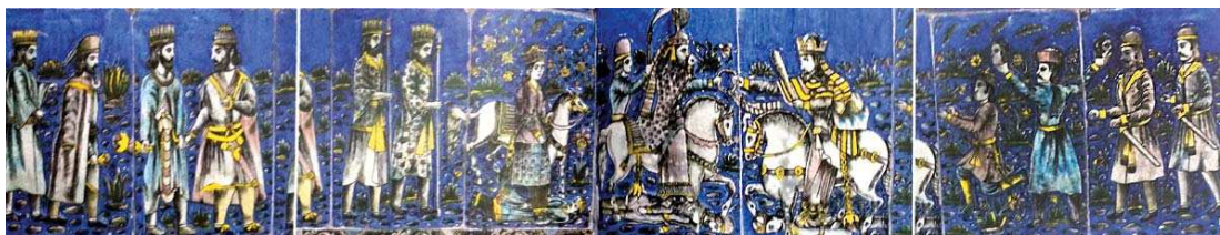
تصویر ۹. تاج‌گیری، بدون رقم، منسوب به کاشی‌نگاران شیراز، بدون تاریخ، منسوب به نیمه اول قرن ۱۴ ه.ق، اندازه: ۲۴۰×۳۲۰، مکان: سردرخانه قدیمی، شیراز. مأخذ: همان.

البته نمی‌توان این گمان را از خاطر دور داشت که مجری این آثار "هم دروازه‌ها و هم سردرها" اغلب هنرمندان کاشی نگار عامه باشند؛ زیرا ارجاعات تصویری با شدت و ضعفی در اجرا چنان نزدیک به دیوارنگاره‌های عمومی حکومتی است