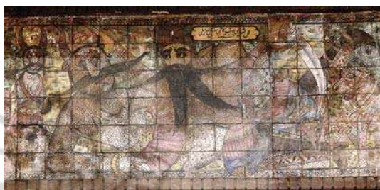
تصویر ۱۲. نبرد رستم و دیو سپید، عمل مشهدی یوسف کاشی‌ساز، ۱۳۰۸ ق، سردر حمام حاج محمدجعفر حج فروش، رشت.

آموزش، تأسیس مراکز آموزشی، دعوت از اساتید خارجی و ستایش دانش و علم، در راه رسیدن به پیشرفت و گریز از عقب‌ماندگی و رسیدن به آرمانی چون جوامع صنعتی غربی با روح مدنیت و قانون‌گرایی، پارادایم سنتی دوره اول سلطنت قاجاریان را به سنت - مدرنیته تغییر داد. اندیشه اصلاحات خواهی با تغییر از هر چه سنتی است و توجه به راهکارهای علمی و مدرن، نه تماماً ضد دینی بلکه بیشتر ضد خرافه دینی بود. شگفتی و حیرت از آنچه این دوره جامعه ایران از پیشرفت غرب مشاهده می‌نمود و ارزشی شدن هر آنچه رنگ و بوی غربی داشت با سفرهای ناصرالدین‌شاه به اروپا افزون گشت. تغییرات فکری که در این بازه زمانی روی داد، به‌تمامی در تغییرات فرهنگی و هنری مؤثر افتاد. تغییر در شیوه نگریستن و آشنایی با اکتشافات علمی، به تغییر سبک در نقاشی به‌عنوان گونه‌ای علمی در کنکاش جهان انجامید و شیوه نگریستن هنرمند را نه هم‌زمان با تحولات اروپا بل به دوره‌ای منتقل نمود که در هنر ایران تجربه نشده بود.