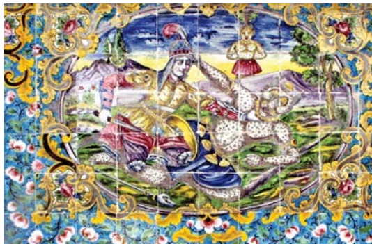
تصویر ۱۱. نبرد رستم و اشکبوس، منسوب به علیرضا قولر آقاسی، نیمه دوم قرن ۱۳، نمای عمارت شمس‌العمار. مؤلف، ۱۳۹۷.