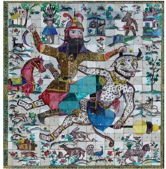
تصویر ۳. جنگ رستم و دیوسپید، شیراز، سردر ارگ کریمخان. مؤلف ۱۳۹۵.

مناسبت‌های تشریفاتی گرفته تا تشکیل انجمن خاقان و تقلید از سبک خراسانی و مدیحه‌سرایی با این سبک و تألیف شاهنامه به نام خود، همه نشان از آغاز دوره‌ای دارد که پادشاه به‌عنوان مظهر وحدت ملی، جایگاه حکومت خود را در امتداد فرهنگ ایران باستان ترسیم می‌کند. اندیشه ایرانشهری دوره قاجار و بالأخص شخص فتحعلی شاه را می‌توان در علت و علل گسترده‌ای جستجو نمود. از اقامت آغامحمدخان و فتحعلی شاه در دربار زندیه، همراهی فتحعلی شاه همراه با عموی خود آغامحمدخان در آرام‌سازی و اتحاد سیاسی کشور، توجه او به وحدت سیاسی و حضور شاه به‌عنوان عامل این وحدت، اقامت در شیراز و آشنایی با آثار باستانی، علاقه به تاریخ و ادبیات و شاهنامه‌گرایی، توجه سیاحان و سفرای دولت‌های اروپایی به آثار باستانی که از دوره صفویه آغاز شده بود تا حضور فرستادگان اروپایی در دربار و هم‌زمانی دوران حکومت او با تحولات اروپای سده نوزده و گرایش‌های نئوکلاسیسم و ناسیونالیسم و توجه به مفهوم ملیت و وطن‌دوستی نزد اروپائیان، همه از عواملی است که در جهت‌گیری شاه تاج و تخت یافته قاجار کم‌وبیش مؤثر واقع شدند.