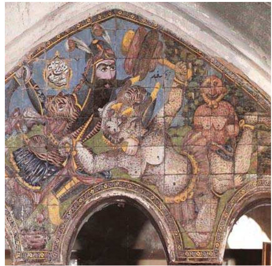
تصویر ۷. جنگ رستم و دیو سپید، بدون رقم، منسوب به استاد موسیقی کرمانی، نیمه اول قرن ۱۳ ه. ق. داخل حمام ابراهیم خان، کرمان.

البته این قهرمان‌پروری و ناجی‌دوستی در خرد جمعی اندیشه ایرانی، سابقه‌ای بس کهن دارد و ریشه‌های آن می‌تواند تا «جوهره آریایی تجلی‌یافته در شاهنامه» نیز جستجو شود؛ اما مددجویی تصویری فتحعلی‌شاه از رستم در دروازه‌های فضای عمومی علاوه بر باز یادآوری خاطره جمعی از مفهوم قهرمان، تصویر شاهی آرمانی در نبرد تن‌به‌تن با دیو و شکست سوژه دیو است. ورود سوژه -بژه تصویری رستم در متن شهری، بالأخص دروازه‌ها و سردرها، حامل پیام تصویری و تبلیغی از سوی قدرت حاکم به مخاطبان، "اعم از ایرانی، غیر ایرانی و بالأخص اروپائیان" است. متن پیام تصویری روشن و صریح در