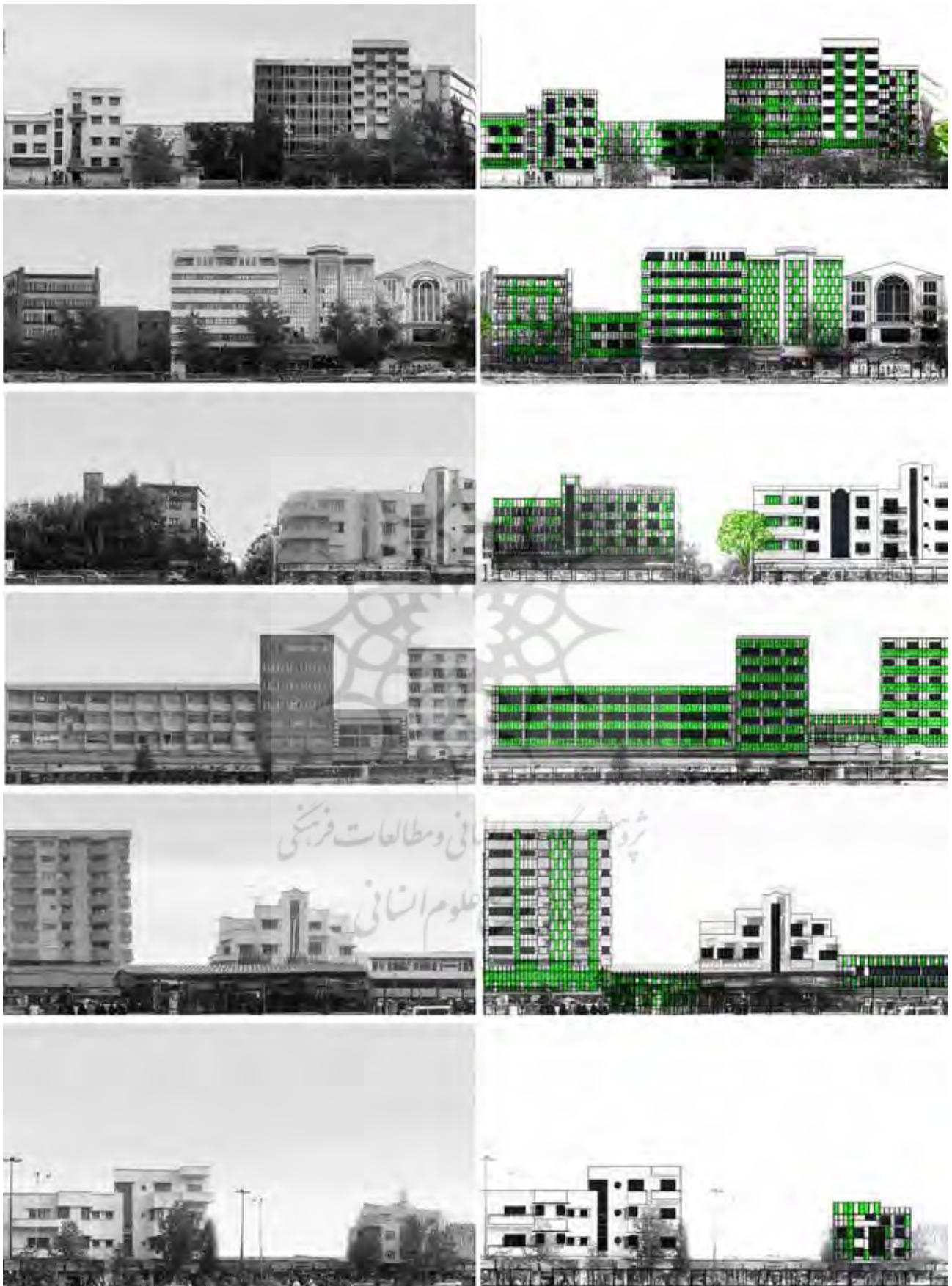
تصویر ۱. ب) مقایسه سیمای شهری جبهه جنوبی خیابان انقلاب با در نظر گرفتن پانل‌های حاوی ریزجلبک.