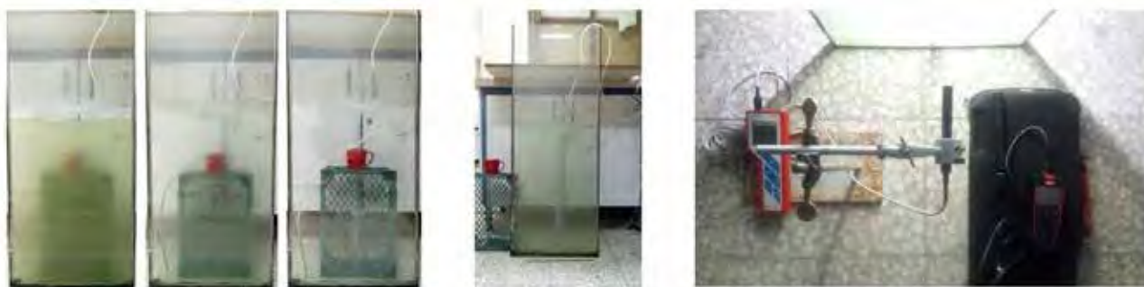
تصویر ۳. زیست رآکتور ساخته شده و تجهیزات مورد استفاده در فرایند آزمایش.

جداره‌های ساختمان و بدنه‌های شهری را با این زیست رآکتور پوشش داد، در بازه زمانی بسیار کوتاه می‌توان میزان دی‌اکسید کربن موجود در هوا را به مقدار قابل توجهی به صورت پایدار کاهش داد و در جهت ارتقای بهبود کیفیت هوا و حفظ و پایداری محیط زیست شهری به‌عنوان سیاست و هدف اصلی این نوشتار، گام مؤثری برداشت.