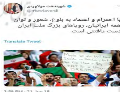
تصویر شماره ۲: تداوم حضور زنان در ورزشگاه