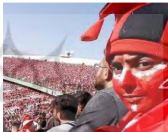
تصور شماره ۱: تمایل زنان برای حضور در ورزشگاه