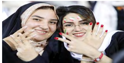
تصور شماره ۳: حضور زنان در ورزشگاه