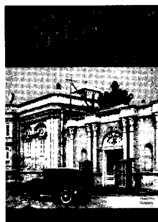
سازمان اسناد و کتابخانه ملی جمهوری اسلامی ایران