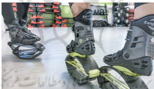
شکل ۱. کفش‌های کانگو جامپ

ظاهری اشاره کرد (۱۹). نوسانات در کفش کانگو جامپ است و بدن برای حفظ تعادل به مقابله با این نوسانات نیاز دارد. این تعادل در فعالیت، حاصل سیستم ویستیبولار، سیستم سنسوری و سیستم دیداری است (۲۰). ضمن اینکه استفاده از موسیقی همراه با تمرینات کانگو جامپ می‌تواند موجب تسریع بهبود عملکرد تعادل کودکان با اختلال طیف اوتیسم شود (۲۱). از این رو بررسی این شاخص‌ها به وسیله فعالیت‌های حرکتی، می‌تواند شایان توجه باشد؛ این در صورتی است که تحقیقات کافی در این زمینه وجود ندارد. ضمن اینکه بیشتر تحقیقاتی هم که به بررسی فعالیت‌های بر روی کودکان با اختلال طیف اوتیسم پرداخته‌اند، هدف آنها ایجاد بهبودی در رفتارهای کلیشه‌ای، تعاملات اجتماعی و مهارت‌های خودیاری بوده و کمتر به جنبه‌های رشدی دیگر مانند عملکرد تعادلی پرداخته شده است (۲۶-۲۲). این در حالی است که این کودکان مشکلات حرکتی زیادی مانند مشکلات تعادلی دارند. به طور کلی با توجه به نقش شایان توجه فعالیت‌های حرکتی و اینکه تا به حال تحقیقی در این زمینه صورت نگرفته است، در تحقیق حاضر به دنبال بررسی تأثیر کانگو جامپ بر عملکرد تعادلی کودکان با اختلال طیف اوتیسم هستیم. در نهایت برای رسیدن به هدف تحقیق حاضر سعی در پاسخگویی به پرسش‌های زیر خواهیم کرد: آیا یک دوره تمرینات کانگو جامپ می‌تواند بر عملکرد تعادلی کودکان با اختلال طیف اوتیسم تأثیر داشته باشد؟