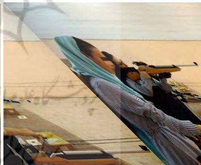
شکل ۱. شرکت‌کنندگان در حال شلیک به سبیل در جلسه دوم