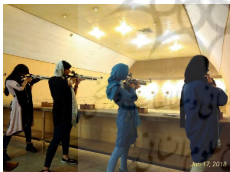
شکل ۲. شرکت‌کنندگان در حال اجرای «شلیک استقامتی بعد از یک دقیقه» در جلسه نهم