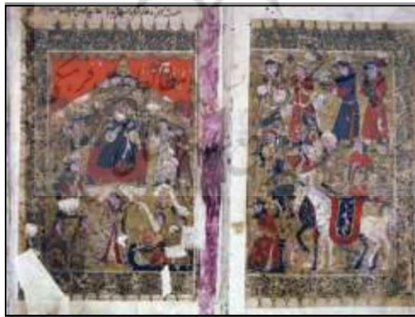
تصویر ۱: نگاره حکومت آل‌اینجو با مضمون بار عام شاهی و رفتن بزرگان نزد پادشاه، عجایب المخلوقات و غرائب الموجودات- ۷۲۲ه.ق..

گنج نه، گوهر فشان، صهبا کش و دستان شنو انوشه خور، طرب کن، جاودان زی باره ده، قصّه ستان، توقیع زن، تدبیرساز درم ده، دوست خون، دشمن پراکن (همان: ۵۵) (همان: ۸۸)