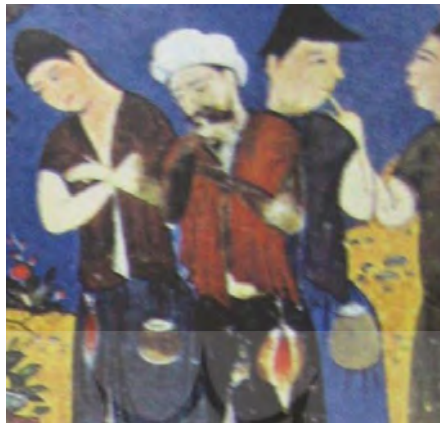
تصویر ۴: نگاره زندانیان در برابر خسرو (از گلچین اسکندرسلطان)، ۸۱۳ق. منبع: (گری: ۱۳۸۵)

نگاره «گلنار و اردشیر» از شاهنامه بایسنقری، نیز که تصویری از زندگی کاخ‌نشینی است که می‌توان در آن انعکاس تقاضا و درخواست را مشاهده کرد. این نگاره که خدمت‌گزاری و احترام به شاه را به تصویر کشیده است و نمایشی از رابطه خادم و مخدوم در دربار است.