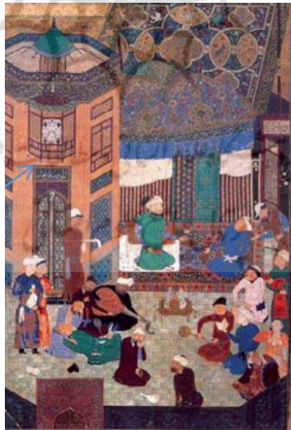
تصویر ۲: جشنی در دربار سلطان حسین میرزا، اثر بهزاد. ۹۴۲ق.

در نگاره‌ی «جشنی در دربار سلطان حسین میرزا»، اثر بهزاد می‌توان نمایی از دیدار رسمی و انعکاس درخواست و تقاضای اطرافیان را از شاه مشاهده کرد. به تصویر کشیدن مجلسی دوستانه و مزین به مطربان و وسایل موسیقی می‌تواند نمایش‌گر درخواست نگارگران بر تشویق شاهان به برگزاری چنین مجالسی باشد.