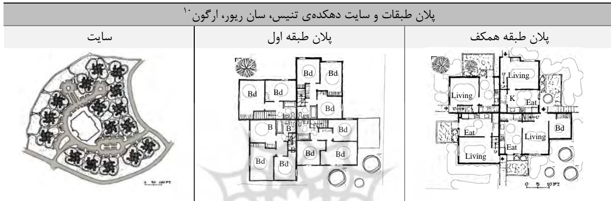
جدول ۳: نمونه مسکن فورپلکس

در مطالعات انجام‌شده به تشریح روشی نو در طراحی مسکونی که پلکس‌سازی نام دارد پرداخته شد که ضمن تشریح ویژگی‌های آن به سبب اهمیت محیط و رفتار اجتماعی می‌تواند طراحی را در راستای تحقق اصول معماری پایدار یاری رساند. مباحث مربوط به اصول پایداری اقلیمی جزء مباحث مهم و اساسی درزمینه‌ی طراحی معماری می‌باشند. با توجه به این موضوع علاوه بر نگرشی جزئی باید نگاهی کلی در این زمینه داشت. علاوه بر اینکه ساختمان‌های طراحی شده هرکدام باید به صورت جداگانه هویت و کمترین میزان مصرف انرژی‌های فسیلی را داشته باشند ولی درعین حال باید به گونه‌ای طراحی شوند که با قرارگیری چندین ساختمان در کنار یکدیگر نیز بتوانند میزان اتلاف انرژی را بسیار کاهش دهند. برای دستیابی به یک ساختار مشخص جهت ارزیابی خصوصیات ویژگی‌های مسکن پلکس، معیارهای مسکن پلکس را می‌توان در قالب سه بعد اقلیمی، اجتماعی و پایداری دسته‌بندی شده است. در (شکل ۲) ابعاد مختلف مسکن پلکس و ویژگی‌های آن ارائه شده است.