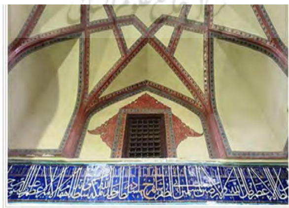
تصویر شماره ۳: کتیبه مسجد دو در متعلق به دوره تیموری (۸۴۳ق).

یکی از این کتیبه‌ها در مدرسه دودر قرار دارد. این کتیبه معرق در سال ۸۴۳ق. همزمان با ساخت بنا ایجاد شده است (امامی، ۱۳۷۵: ۱۵۰). این کتیبه نیز به شکل طوماری و تک خط است.