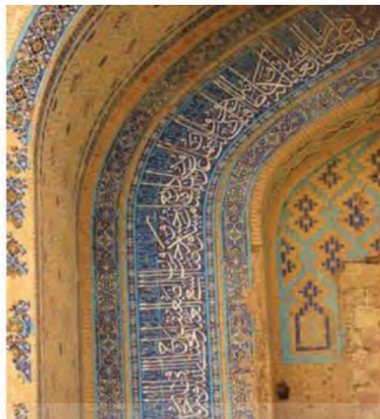
تصویر شماره ۲: کتیبه طوماری در مسجد خرگرد از بناهای دوره تیموری، ساخته شده در سال ۸۴۸ق.

این کتیبه که از نوع کتیبه‌های طوماری است به خط ثلث و کوفی است و دربردارنده مضامین مذهبی است. بررسی مفاد این کتیبه نشان می‌دهد، القاب شاهرخ که در سلطنت او این بنا ساخته شده است با کاشی معرق در این کتیبه تکرار شده است. واکاوی داده‌های آموزشی این کتیبه به نوعی تکرار روزمره صفات و القاب شاهی برای علم‌آموزانی است که در این مدرسه مشغول به تحصیل بوده‌اند در حقیقت می‌توان از آن به عنوان مشق وفاداری سیاسی برای علم‌آموزان یاد کرد.