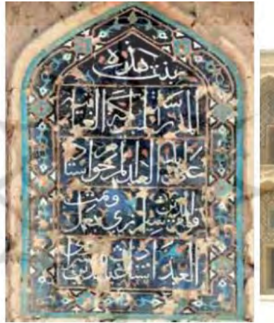
تصویر شماره ۱: کتیبه احداثیه مسجد خرگرد

مطالعه و واکاوی مفاد کتیبه‌های موجود در معماری دوره تیموری نشا می‌دهد این آثار دارای ارزش و اهمیت آموزشی هستند. کتیبه‌های این دوره را می‌توان در بناهای مختلفی مانند مساجد، خانه‌ها و بناهای عام‌المنفعه مانند کاروانسراها مشاهده نمود. بخشی از اطلاعات این کتیبه‌ها که گواه بر دوره ایجاد و مقطع تاریخی خاصی است در بردارنده نکات آموزشی مفیدی است. کتیبه‌های تاریخی شناسنامه بنا هستند. متن این کتیبه‌ها در بردارنده اطلاعاتی درباره بانی، مباشر، معمار و تاریخ ساخت بنا است و از آنجا که اطلاعاتی درباره احداث بنا را می‌دهد به آن‌ها کتیبه‌های احداثیه نیز گفته می‌شود. در کتیبه‌های احداثیه متن را چنان تنظیم می‌کردند که نام حاکم وقت درست در وسط کتیبه قرار گیرد (طیسی و رئوف‌حجار زرین، ۱۳۹۲: ۳). کتیبه‌های احداثیه معمولاً در بردارنده اطلاعات تاریخی مفیدی هستند.