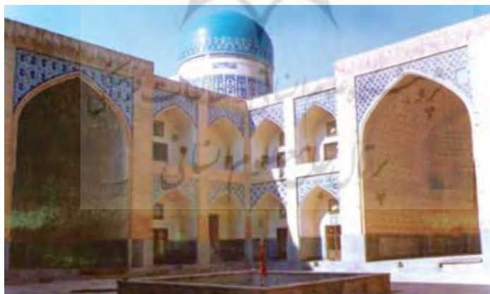
تصویر ۳: نمای بیرونی مسجد دو در. (شراتو، ۱۳۷۶: ۱۳۴)

"طرح تزئینی گنبد نقش خورشیدی است با داوایر متحدالمرکز شامل ترنج هایی که به صورت اشعه ی خورشید تنظیم یافته و از راس گنبد منشعب می شوند و در واقع نمایش سمبولیک نظام عالی هستی است. پوشش کاشی فعلی حیاط احتمالاً مربوط به تعمیرات دوره ی صفوی است که جانشین تزئینات مشابه تیموری شده است." (ویلبر، ۱۳۷۴، ج ۱: ۴۶۶)