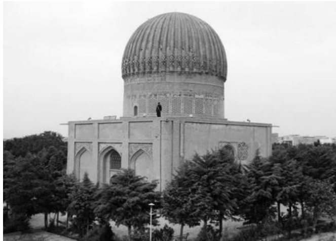
تصویر ۲: مقبره گوهرشاد، (ابراهیمی، ۱۳۹۷: ۱۵۷)

"مسجد و مدرسه این مجموعه، پلان چهار ایوانی متداول، با صحنی بزرگ و مناره های بسیار بلندی دارد که در هر یک از چهار گوشه ی بنا قرار گرفته است. چهار مناره به ارتفاع ۱۲۰ پا در چهار گوشه بنا قرار داشته است. حیاط با رواق هایی دوطبقه احاطه شده بود. بر روی محورهای حیاط چهار ایوان وجود داشته که ایوان مقصوره با ایوان ورودی (۸۰ پا) به یک ارتفاع بوده است." (ویلبِر، ۱۳۷۴: ۴۲۱ و دانلد، ۱۳۸۷: ۷۸). "از روی مناره ها می توان به غنای تزئین مسجد پی برد که این مسجد کاملا با کاشی پوشیده بوده است. اکنون تعداد زیادی از این لوحه های مرمری در آرامگاه گوهرشاد موجود است." (ویلبِر، ۱۳۷۴: ۴۲۱)