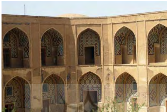
تصویر ۴: نمای بیرونی صحن داخلی، مدرسه غیاثیه خردگرد (خزایی، ۱۳۸۸: ۷۰)

مدرسه خردگرد ۱۱ به سال ۸۴۸ ق. در زمان شاهرخ و به دستور پیر احمد خوافی وزیر، ساخته شده است. (تصویر ۴) معمار اولیه این بنا، قوام آلدین شیرازی بوده و سپس به دست غیاث آلدین شیرازی به پایان رسیده است. این مدرسه، دو گنبدخانه، یک مسجد با گنبدی بر روی قوس های کشیده و درسخانه ای با یک گنبد فوق العاده روی قوس های متقاطع و برجکی نورگیر دارد، این طرح بدیع در آرامگاه بایسنقر که قوام الدین شیرازی در هرات ساخته، تکرار شده است (تاکستن و دیگران، ۱۳۸۴: ۵۸).