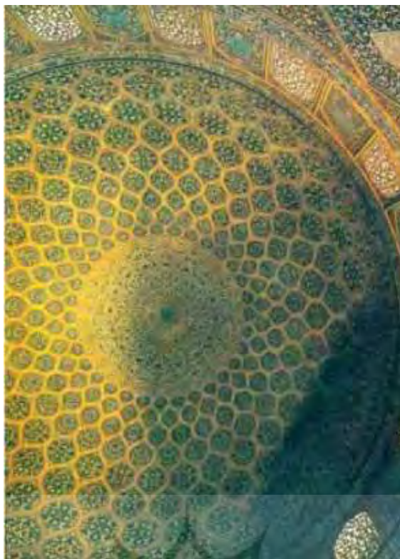
تصویر ۲- زیر گنبد مسجد شیخ لطف الله اصفهان، حلقه ی مرکزی و نمایش وحدت در کثرت.

"خلق و آفرینش، رکن عالم هنر است. هنرمند با "خلق" اثر هنری می کوشد نوعی ارزش زیبایی شناختی ایجاد کند. ... (شهادی، ۱۳۹۳: ۳۰)