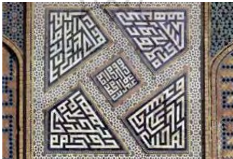
تصویر ۸- حیاط مسجد جامع اصفهان. (شایسته فر، ۱۳۸۴: ۱۷۵)