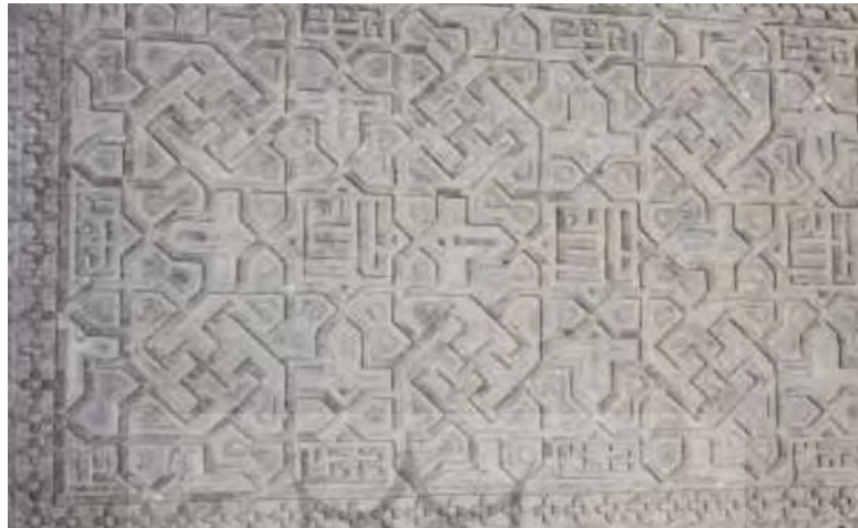
تصویر ۷- نوشتاری که در عین کثرت وارگی ساحتی واحد دارد. تزئینات روی ستون های ایوان مسجد جامع اصفهان.

جذابیت بصری خطوط خوشنویسی شده بر کتیبه های مساجد، در برابر دیدگاه بیننده و ذهن او نقش مفهومی فرازمینی و معانی نمادین برگرفته از ذات الهی را بیان می دارد. بنابراین "حروفی که در عین کثرت وارگی خویش، ساحتی واحد را تشکیل میدهند، امکان سیر معانی و مفاهیم معنوی را از صورت به معنا فراهم کرده و در ساختار صوری و باطنی خود، تداعی کننده رمز خلقت و حقیقت الهی می باشند." (احسنت؛ گودرزی سروش، ۱۳۹۶: ۱۲۱) استفاده از واژه هایی در کتیبه های بناهای اسلامی که نمایانگر وحدت در عین کثرت هستند. (تصویر ۷ و ۸)