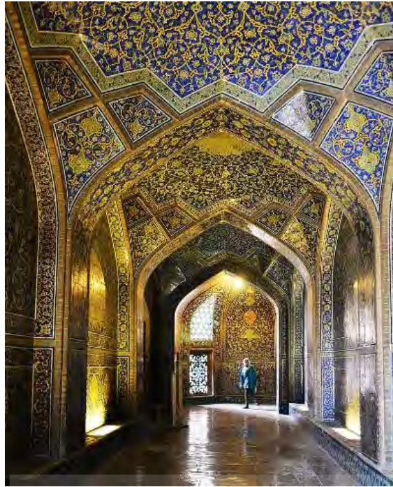
تصویر ۴- فضای داخلی از مسجد شیخ لطف الله اصفهان، راهروی ورودی. منبع تصویر (بمانیان؛ عالی نصب، ۱۳۹۱: ۷۷)

یکی از مسائل اساسی هنر اسلامی، ارتباط با سرچشمه ی الهی است. هنر به مانند الگویی برای فهم آفرینش و خالقیت و فاعلیت خدا به کار رفته است. در فلسفه اسلامی هنر پاسخی ست در خور برای تبیین فعل خدا. در واقع خلاقیت انسان و فعل او، همانند خداوند، در عرصه ی هنر است که جلوه گری می نماید.