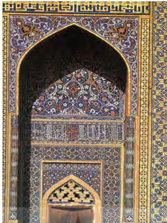
تصویر ۵- "آنا مدینه العلم و علی بابها"، مسجد جامع اصفهان.

"خوشنویسی" در مقام شاخصترین هنر اسلامی ریشه در معنویت دارد. خوشنویسی اسلامی بیان مادی و زمینی مفاهیم آسمانی است. به بیانی، خوشنویسی اسلامی تجلی حقیقت معنوی کلام الهی است. خوشنویسی اسلامی راز و رمز معنوی و روحانی در خود می‌پروراند. این هنر تجلی گاه امری قدسی است و بیش از هر جایی بر بستر کتیبه‌هایی در معماری نمود دارد. از این رو؛ کتیبه‌نگاری به واسطه‌ی هم راستا و هم سو شدن با خوشنویسی و به عنوان بستری برای نمایش و ظهور مفاهیم معنوی و الهی در قالب خط در معماری اسلامی، دارای قداست و تقدس بوده است. در معماری اسلامی کتیبه‌های با مضمون ادعیه انعکاس مفاهیم الهی هستند. از آن نمونه است کتیبه با مضمون دعای جوشن کبیر در محراب مسجد حکیم اصفهان. (تصویر ۶)