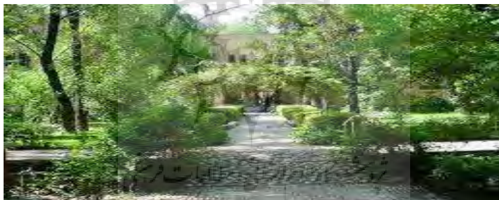
تصویر قلعه زیبای فلک الافلاک

قلعه فلک الافلاک هم اکنون به عنوان یک اثر تاریخی مورد بازدید عموم است و دارای کتابخانه، نمایشگاهی از سنگ نوشته‌ها و نیز موزه مردم‌شناسی و موزه اشیاء باستانی است. همچنین ساختمان قدیمی دانشگاه لرستان در درون محوطه