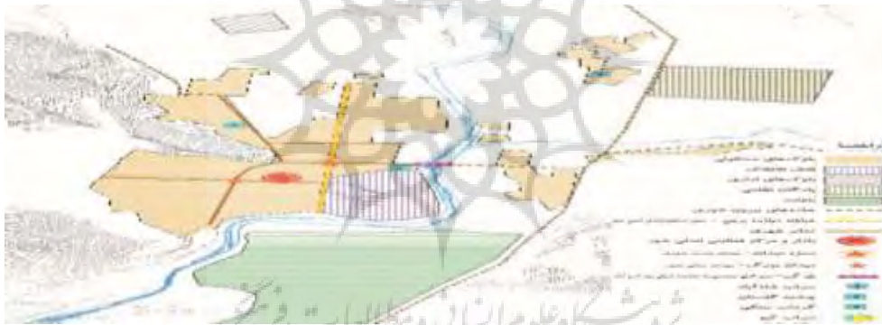
نقشه عناصر اصلی شهر خرم آباد در سال ۱۳۳۳

پس از احداث پل های "شهداء" در امتداد خیابان شهداء و "حاجی" در امتداد خیابان دوازده برجی (خیابان امام خمینی) مکان برقراری ارتباط با ساحل دیگر رودخانه تسهیل شده و همین امر سبب گسترش محدوده شهر به سمت شمال و جنوب آن می شود که احداث پل "حاجی" بیش از پیش بر اهمیت خیابان دوازده برجی افزوده و سبب تثبیت اهمیت خیابان مذکور در استخوان بندی شهر می شود.