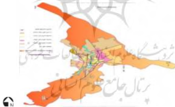
روند توسعه کالبدی شهر خرم آباد

روند توسعه شهر خرم آباد پس از وقوع انقلاب اسلامی از مهاجرت گسترده روستاییان و عشایر تأثیر اساسی پذیرفته است. از طرف دیگر وجود روستاهای مناسب برای ساخت و ساز شهری در مسیر توسعه کالبدی شهر خرم آباد مانند ماسور، اسپستان، فلک الدین از عوامل مهم دیگر در توسعه کالبدی شهر است. در فاصله سال‌های ۱۳۵۳ تا ۱۳۹۰ با وجود رشد جمعیتی بالا، سطح اراضی شهری از ۱۰۴ هکتار به بیش از ۴۰۰۰ هکتار رسیده است که این خود حکایت از توسعه ناموزون شهر دارد.