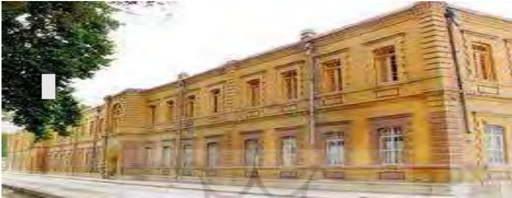
ساختمان قدیمی در محوطه دانشگاه

آن قرار دارد. این ساختمان متعلق به دوران پهلوی اول است و دارای ویژگی‌های معماری این دوره است. این بنا از تزئینات آجری زیبایی برخوردار است. قبل از احداث ساختمان دانشگاه لرستان به عنوان مرکز آموزشی مورد استفاده بوده است. این اثر در محدوده حریم درجه یک قلعه فلک الافلاک قرار دارد.