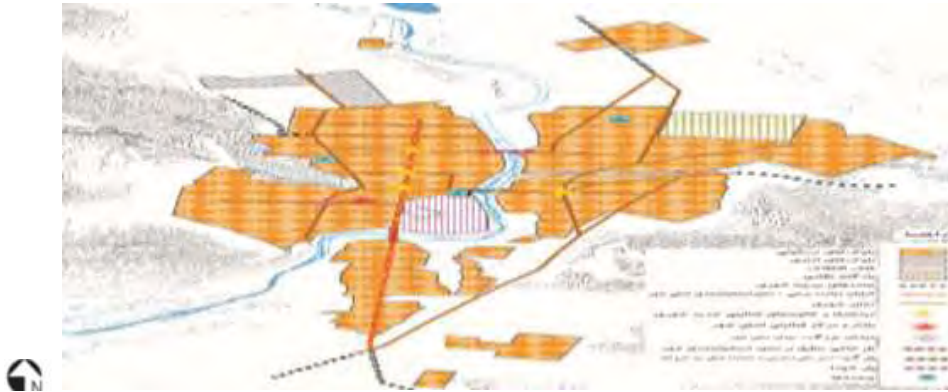
نقشه توسعه شهر در سال ۱۳۵۳

روند توسعه شهر خرم آباد پس از وقوع انقلاب اسلامی از مهاجرت گسترده روستاییان و عشایر تأثیر اساسی پذیرفته است. از طرف دیگر وجود روستاهای مناسب برای ساخت و ساز شهری در مسیر توسعه کالبدی شهر خرم آباد مانند ماسور، اسپستان، فلک الدین از عوامل مهم دیگر در توسعه کالبدی شهر است. در فاصله سال‌های ۱۳۵۳ تا ۱۳۹۰ با وجود رشد جمعیتی بالا، سطح اراضی شهری از ۱۰۴ هکتار به بیش از ۴۰۰۰ هکتار رسیده است که این خود حکایت از توسعه ناموزون شهر دارد.