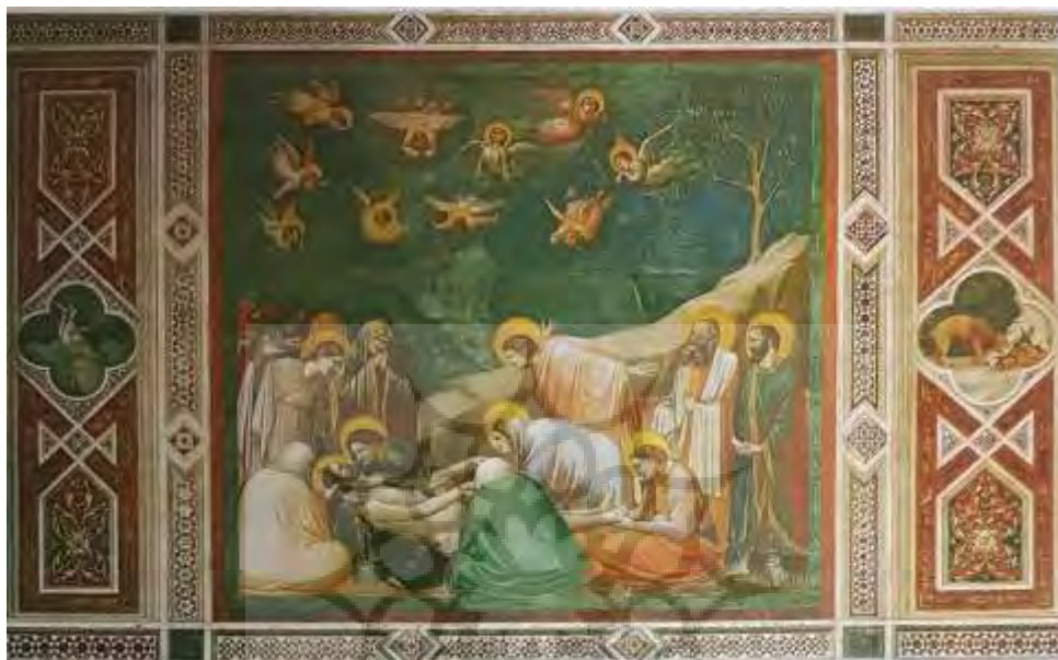
تصویر ۳- سوگواری، ۱۳۰۶-۱۳۰۵ میلادی، اثر جوتو، نقاشی دیواری نمازخانه آرنا (اسکرووگنی)، پادوا، ایتالیا. (جنسن، ۱۳۸۸: ۴۴۷)

مسیح به شکل تصنعی به تصویر کشیده شده، غیر واقعی بودن جهش خون از بدن مسیح، حضور مجسمه پای صلیب از روحانی بودن تصویر می‌کاهد.