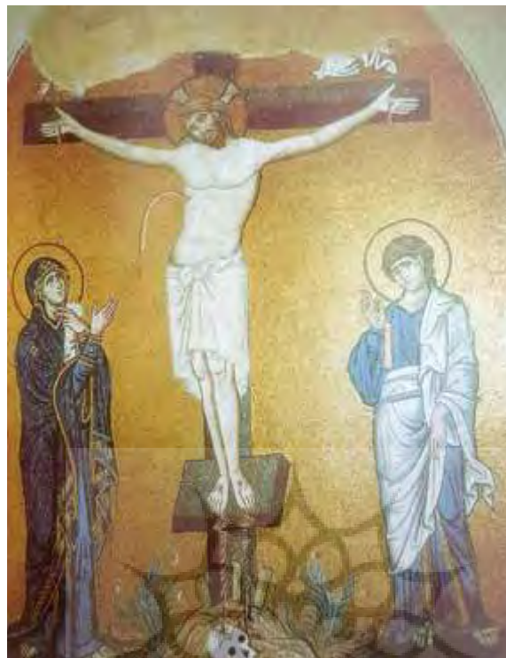
تصویر ۴- تصلیب موزاییک، کلیسای خواب ابدی مریم عذراء، دافنی، یونان (جنسن، ۱۳۸۸: ۲۶۸).

جدول ۴- مقایسه نقاشی مسیح دوره گوتیک و دوره بیزانس (منبع: نگارندگان)