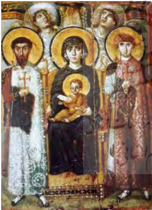
تصویر ۲- مریم و کودک نشسته بر تخت اوایل سده ششم میلادی

فلورانس کشیده بود. جوتو ملکه بهشت - مریم- و پسرش را جلوس کرده در میان فرشتگان و در برابر پس زمینه‌ای طلایی تصویر کرده است. ردای آبی سیر مریم عذرا و ابعاد عظیم او در تصویر چشم بیننده را مستقیم به سمت او و به سمت مسیح کودک در آغوش او می‌کشاند. تمامی دیگر پیکره‌ها به آن دو زل زده‌اند تا نشانه و تشدید کننده اهمیت آنها باشند. خود تخت نیز بر اساس معماری گوتیک ایتالیایی شکل گرفته است، تخت حضرت مریم را از سه جانب در بر گرفته، او را از پس زمینه طلایی رنگ جدا نگاه می‌دارد. پیکره‌های همپوشان، به گونه‌ای که به نظر می‌رسد هر یک در پس دیگری ایستاده به شکل‌گیری فضا کمک می‌کنند (جنسن، ۱۳۸۸، ۴۴۷). در مقایسه صحنه مشابه این اثر را در دوره بیزانس داریم که در آن مریم مقدس و کودکش کشیده شده، در حالی که دو قدیس جنگجو، گمان می‌رود تئودور در سمت چپ و گئورگ (یا دمتیوس) در سمت راست، پیکره‌های خشکی همراهان یوستینان در سن ویتاله را به یاد می‌آورند.