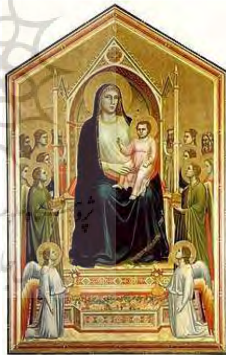
تصویر ۱- بر تخت نشستن مریم، اثر جوتو،