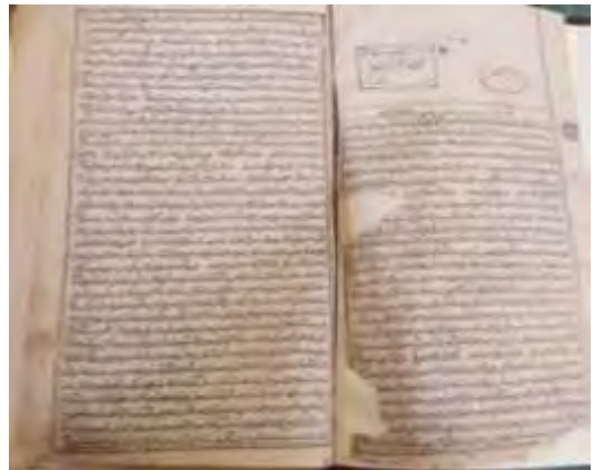
تصویر ۲- صفحه عنوان، روضه المجاهدین، ۱۳۰۶ ق، (منبع: نگارنده).

این صفحه بدون تزئین بوده و همانند سایر نسخ و کتب ایرانی با عنوان "بسم الله الرحمن الرحيم" آغاز می شود. متن صفحه عنوان با صلوات بر حضرت رسول اکرم (ص) شروع شده و در ادامه توضیحاتی درباره باب ها و فصول موجود در کتاب آمده است. در این صفحه توضیحاتی در مورد وقایع رخ داده بعد از شهادت حضرت ابا عبدالله و در زمان مختار ذکر گردیده است. این صفحه به خط نسخ کتابت شده است.