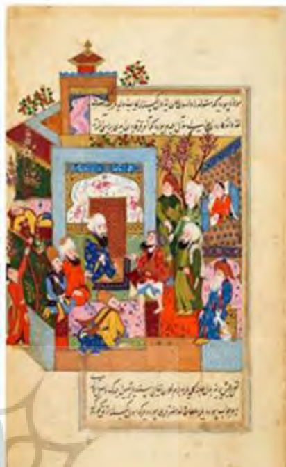
تصویر (۱) مضمون کرامات اغراق آمیز و ارتباط با غیب تصویر (۲) مضمون عرفانی و ارتباط با عالم قدس