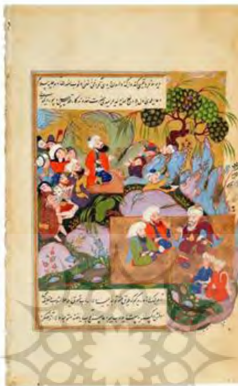
تصویر ۵) مضمون انتساب به اولیای اسلام

تصویر ۴) مضمون بیان کرامات غیر منطقی معجزات