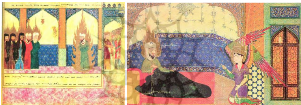
تصویر ۱ - سیرزمینی - نزول جبرئیل بر پیامبر (سگای، ۱۳۸۵: نگاره شماره ۲). تصویر ۲: ورود پیامبر به مسجد مقدس اورشلیم (سگای، ۱۳۸۵: نگاره شماره ۴).

اثر خود را بر اساس درخشندگی رنگها، شفافیت خط، توجه به ریزه کاری و جزئیات در تزئینات، نادیده انگاشتن عمق، کوتاه نمایی تصویر در فضای کف اتاق، فقدان سایه روشن و گسترش افقی تصویر خلق کرده است. فرشته بال های رنگارنگ، پیراهن سبز، ردایی بنفش، تاج و هاله ای طلایی و هاله ای قرمز در اطراف پاهای خود دارد و جلوی پای پیامبر که در حال برخاستن از بستر خود است زانو زده. پیامبر با هاله ای نورانی احاطه شده و دستار سفید به نشانه ایمان و سعادت به سر دارند. در بسته ی پشت سر جبرئیل به فضای کاملاً بسته و سِری تأکید می کند. کلیه فضای اتاق شامل تزئینات مشبک در و دیوار های کاشی کاری و گچبری شده بر اساس معماری و تزئینات هندسی و کاشیکاری دوره ی تیموری صورت گرفته است. پیامبر با لباس سبز در میان بستری قرمز، بالشتی زرد و رواندازی سبز تیره (متمایل به مشکی) قرار دارند. انتخاب این رنگ ها بخصوص ترکیب سیاه و قرمز و زرد چشم بیننده را به سمت ایشان جلب می کند. رنگ سبز تیره برای ایجاد تضاد و در نتیجه جذابیت و کاهش گسترش و شدت رنگ قرمز به کار رفته و زرد متمایل به آکر نسبت به سایر رنگ ها به میزان کمتری استفاده شده است.