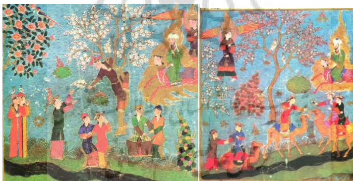
تصویر ۵: سرگرمی حوریان (سگای، ۱۳۸۵: نگاره شماره ۴۲).

در باغ های بهشت، پیامبر (ص) در حالی که با هاله ی نور احاطه شده در معیت جبرئیل، براق را می راند، تعداد زیادی از زنان جوان و زیبا را می بیند. بعضی شوخی و بازی می کنند، عده ای از درختان بالا می روند و گل می چینند و برخی روی صندلی های طلا نشسته و با خوشحالی به گفتگو پرداخته اند. پرنده گان شگفت انگیز بر سر آنها فرود می آیند. آسمان آبی روشن بدون هیچ ابر و نوری، فرشتگان با موهای پوشیده از پر، لباس های رنگارنگ، زمین سبز و جوی آب روان نقره ای نقاشی شده است.(تصاویر ۵ و ۶) قرآن در سوره ی بقره آیه ی ۲۵، بهشت را به زبان تصویر توصیف می کند که شباهت زیادی به این نگاره دارد. روش نمایش زمین در این باغ ها، از مکتب مغولی الهام گرفته شده است. در این روش، بخش های طولی مشابه به تدریج به سمت افق اضافه می شوند. گیاهان، برگرفته از نقاشی شرق دور است. ساقه ها با یک ضربه ی قلم، نقش شده وبوته ها با تنه ی پرپیچ و خم و شاخه های درهم پیچیده با گل ها پوشیده شده اند.