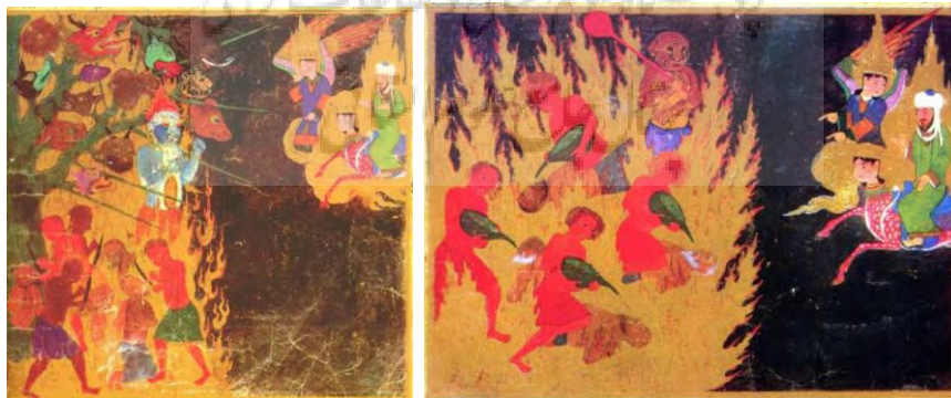
تصویر ۷- دوزخ (سیر آسمانی) - عذاب غاصبان سهم یتیمان (سمت راست) (سگای، ۱۳۸۵: نگاره شماره ۵۲). تصویر شماره ۸: درخت دوزخی برگرفته از آیه ۶۲ سوره صافات (سگای، ۱۳۸۵: نگاره شماره ۴۵).

پس از ترک بهشت دومین مرحله سفر پیامبر آغاز می شود. جبرئیل دوزخ را به پیامبر نشان می دهد و ایشان عذاب کیفر شوندگان در هفت دوزخ را می بینند. این بخش آخرین نگاره های کتاب و شامل ۱۶ تصویر با مضامین انسان های گناهکاری در حال زجر کشیدن، شیاطینی با چهره های برافروخته و اغلب بدن های سرخ و سیاه و ترسناک که آتش از دهانشان زبانه می زند، در فضایی سیاه رنگ و آکنده از آتش سرخ می باشد. جبرئیل با لباس های رنگارنگ خود در یک نگاره مقابل پیامبر، در یک نگاره جلوتر از ایشان و در بقیه نگاره ها همراه و نزدیک ایشان قرار دارند. پیامبر سوار بر براق در همه نگاره ها در سمت راست تصویر در حال ورود به صحنه ترسیم شده اند. تصاویر شماره ۱ و ۸ نگاره هایی از دوزخ نشان داده شده است، پیامبر از سمت راست تصویر سوار بر براق وارد فضایی تیره و کدر می شوند و جبرئیل با همان لباس ها و بالهای رنگارنگ کنار ایشانند. دیوها با هیبت بزرگ و وحشتناک در میان آتش طلایی و سرخ قرار گرفته اند. این نگاره ها به دو بخش تقریباً مساوی تقسیم شده و پیامبر و جبرئیل در سمت راست و کاملاً مجزا و به دور از آتش و دیو و عذاب شوندگان قرار دارند. عمده رنگ های به کار رفته در این نگاره ها (به غیر از جبرئیل، پیامبر و براق) عبارتند از سیاه در زمینه، سرخ و طلایی در آتش و عذاب دهندگان که این دو رنگ بیشترین بخش ها را به خود اختصاص داده اند. سایر رنگ ها سبز، در درخت و ظرف های زهر، لاجوردی و بنفش و قهوه ای می باشد.