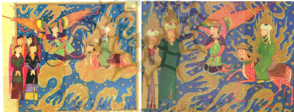
تصویر ۳- ملاقات پیامبر با حضرت یعقوب و یوسف (ع) (سگای، ۱۳۸۵: نگاره شماره ۱۶).

در آسمان سوم عموماً رنگ دستارها سفید است که عمدتاً به عنوان یکی از رنگ های بهشت، در نظر گرفته می شود. لباس پیامبران سبز یشمی و آکر با دستاری سفید است. دستار در اسلام نمادی از وقار و قدرت و معمولاً نشانه تمایز مسلمان از کافر است. اجزای تصویری این صحنه ها بسیار به هم شبیهند. حالت همه پیکره ها یکسان است؛ تنها صورت ها، موقعیت دست ها و آرایش بال فرشتگان، در ترکیب ها تنوع به وجود آورده است. (تصاویر ۳ و ۴)