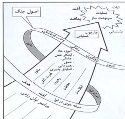
شکل (۱) انواع عملیات طیف کامل بر اساس آیین‌نامه