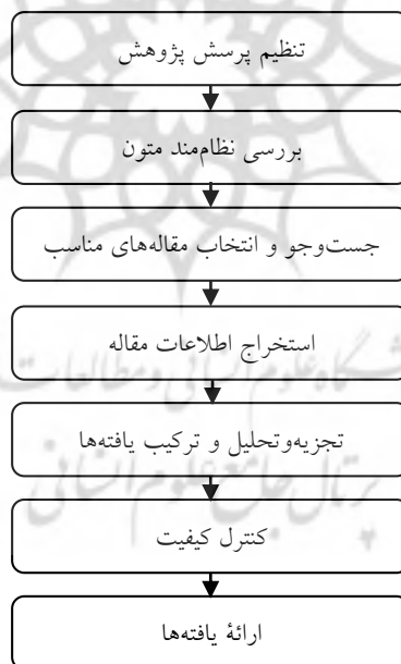
شکل ۱. مراحل هفت‌گانه پژوهش

در این پژوهش از روش هفت‌مرحله‌ای فرا ترکیب سندلوسکی و باروسو ۲ (۲۰۰۳) استفاده شده که در شکل ۱، نشان داده شده است.