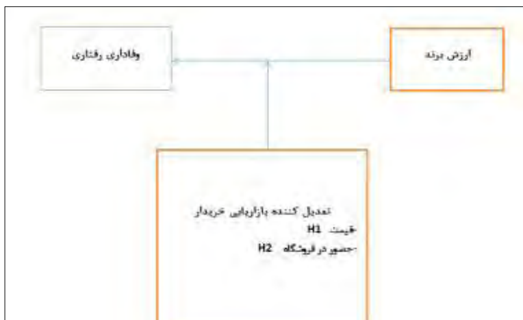
شکل (۱) مدل مفهومی پژوهش