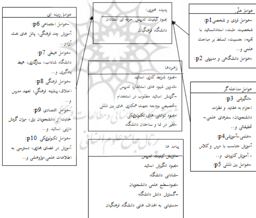
شکل ۲- الگوی تدریس با کیفیت استادان

ب: از دیدگاه متخصصان و اعضاء ستاد آموزشی دانشگاه فرهنگیان الگوی تدریس با کیفیت استادان دانشگاه فرهنگیان چگونه است؟ در مرحله چهارم عوامل استخراج شده از نظرات مدیران آموزشی و خبرگان به روش کد گذاری باز و محوری استخراج شده اند به ترتیب مرتب و موارد تکراری و مشابه حذف و موارد نهایی که شامل ۵۸ عامل بود استخراج شد. الگوی نهایی جهت تدریس حرفه ای با کیفیت در بین استادان دانشگاه فرهنگیان در شکل شماره ۲ قابل مشاهده است.