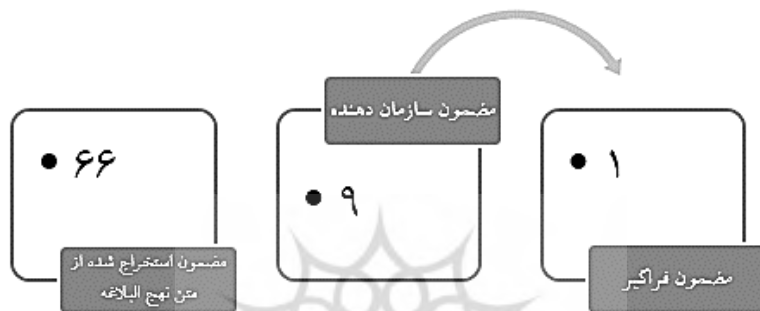
شکل شماره ۱. نحوه استخراج مضامین

کدگذاری توصیفی و تفسیری متون آغاز گردید. ضمن کدگذاری، برخی از مضامین اصلی شناسایی شدند سپس این مضامین در قالب مضامین سازمان دهنده و در نهایت مضامین فراگیر طبقه‌بندی شدند. لازم به ذکر است که یادداشت‌برداری و ثبت اندیشه‌ها و تفسیر داده‌ها در طول مراحل مختلف کدگذاری انجام می‌شود که به استخراج الگو کمک خواهد کرد با بررسی متون و مرور اسناد ۶۶ مضمون شناسایی شدند که این تعداد مضمون در ۹ مضمون سازمان دهنده و ۱ مضمون فراگیر طبقه‌بندی شد که در شکل شماره ۱ نشان داده شده است.