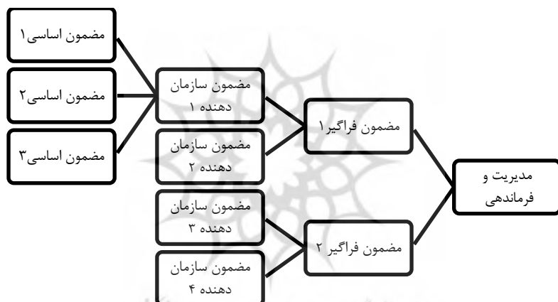
شکل شماره ۲: نحوه شکل‌گیری مدیریت و فرماندهی با استفاده از مضامین

جهت نشان دادن مضامین استخراج شده از روش ماتریس زیر نشان داده شده است. هر مضمون فراگیر متشکل از چند مضمون سازمان دهنده و هر مضمون سازمان دهنده متشکل از چندین مضمون اساسی می‌باشد. آنچه در این تحقیق در نظر گرفته شده مضامین فراگیر معادل ابعاد و مضامین سازمان دهنده معادل مؤلفه‌ها و مضامین اساسی معادل شاخص‌ها در نظر گرفته شده است (Braun & Clarke, 2006, p.95).