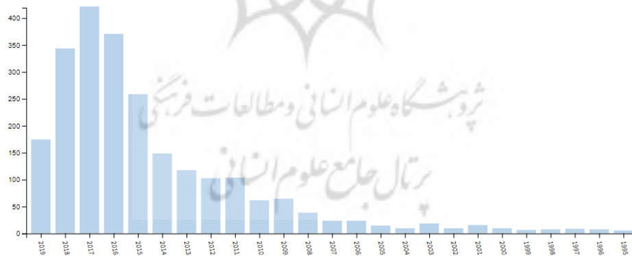
نمودار ۲: سال انتشارات مطالعات اولیه مرتبط به مرور ادبیات

همان گونه که در نمودار ۲ نشان داده شده است، مفهوم تفکر طراحی از سال ۱۹۸۵ تا ۲۰۱۹ دارای سیری افزایشی است که همین امر، اهمیت انجام پژوهش های مرتبط با این مفهوم را دوچندان می کند.