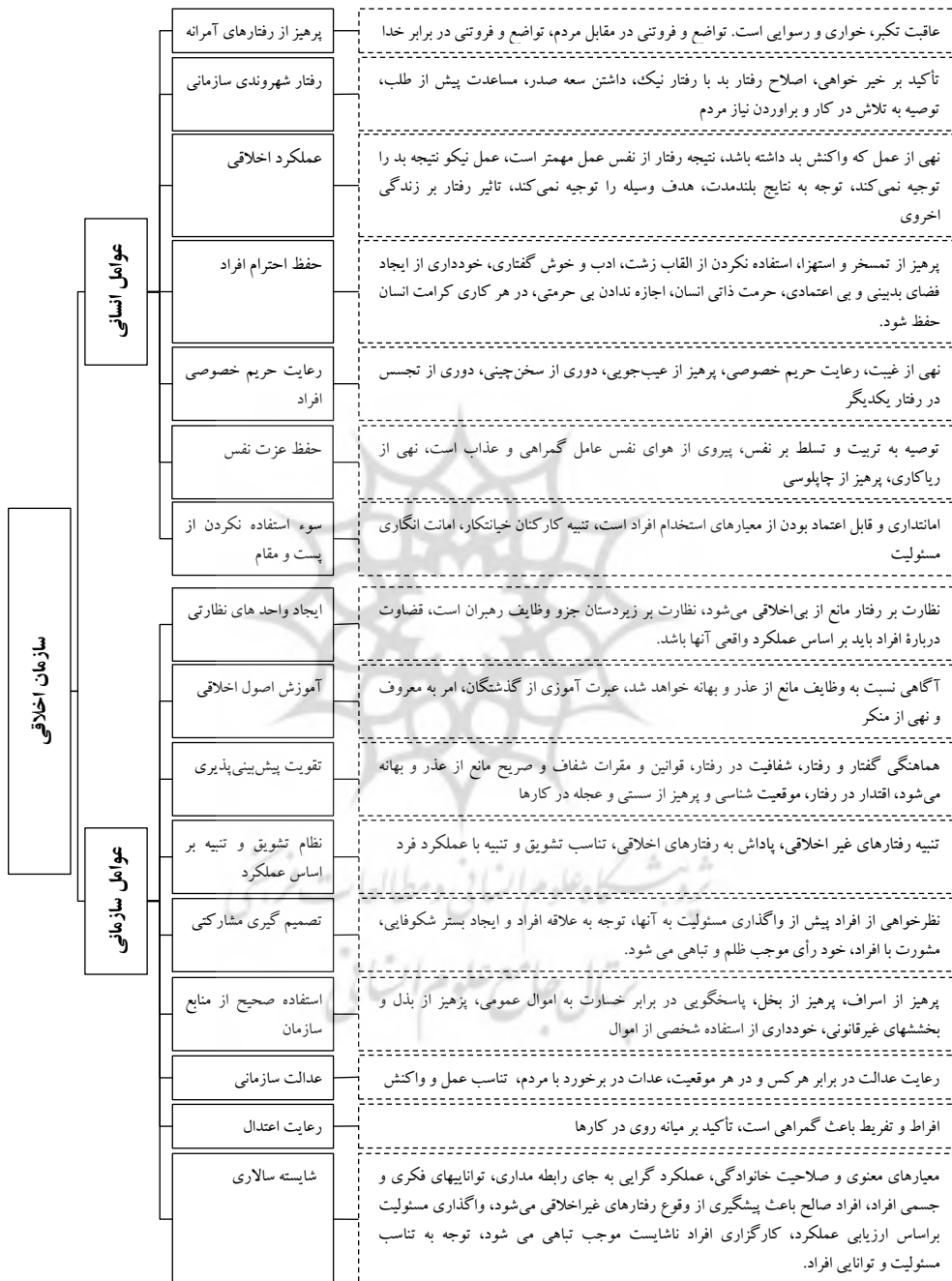
شکل ۳. شبکه مضمونهای نتایج تحلیل مضمون