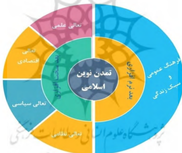
شکل ۳. ابعاد و مؤلفه‌های تمدن نوین اسلامی

مؤلفه‌های تمدن نوین اسلامی و الزامات شکل‌گیری آن بتواند درک درستی از این چشم‌انداز فراهم، و با ارائه چارچوب مشخص انطباق‌پذیری صحیح برنامه‌ریزی، هدف‌گذاری و بسیج منابع در مدیریت کلان کشور را آسان کند. براساس مضمونهای استخراج‌شده و با استناد به بیانات مطالعه شده به زعم نویسندگان این پژوهش، تمدن نوین اسلامی دارای دو بعد و پنج مؤلفه است. مقام معظم رهبری در بعد نرم‌افزاری، که از آن به بعد اساسی و متن تمدن نوین اسلامی یاد می‌کنند به مؤلفه‌های فرهنگ عمومی و سبک زندگی عمومی و سبک زندگی اسلامی تأکید می‌کنند. در بعد دوم یا همان بعد سخت‌افزاری، نظامات پیشرفته مطرح می‌شود و مؤلفه‌هایی همچون تعالی علمی، تعالی اقتصادی، تعالی سیاسی و تعالی نظامی (شکل شماره ۳).