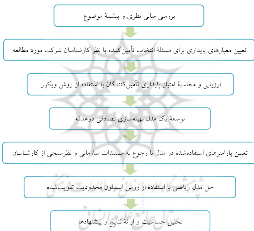
شکل ۱- مراحل پژوهش

در رابطه مذکور، پارامتر ph نشان‌دهنده احتمال وقوع رویداد اختلال برای تأمین‌کننده h است که با توجه به نظر خبرگان و داده‌های تاریخی تعیین می‌شود. مدل ریاضی پیشنهادی در مقایسه با مدل کمال‌احمدی و ملت‌پرست (۲۰۱۶)، چندمحصولی و دوهدفه است و علاوه بر تابع هدف هزینه کل مورد انتظار، تابع هدف جدیدی برای لحاظ کردن مفهوم پایداری در مسئله انتخاب تأمین‌کنندگان و نیز محدودیت‌هایی مانند محدودیت حداقل سفارش به هر تأمین‌کننده و حداکثر نرخ خرابی قطعات تعریف شده است. نرخ خرابی به درصد قطعاتی اشاره دارد که از شرکت تأمین‌کننده به صورت معیوب ارسال می‌شود که این خرابی‌ها ممکن است به علت حوادث حمل‌ونقل، مسائل تکنولوژیکی و خطاهای انسانی رخ دهد. همچنین این پژوهش به کاربرد عملی مدل ارائه شده در شرایط واقعی توجه کرده است. همانگونه که بیان شد، در مدل پیشنهادی، پارامتری برای انعطاف‌پذیری ظرفیت تأمین‌کنندگان در نظر گرفته شده است که به آنها امکان می‌دهد هنگام مواجه شدن سایر تأمین‌کنندگان با ریسک اختلال، نیاز شرکت را با تحویل قطعاتی بیشتر از میزان سفارش تخصیص یافته به آنها برآورده کنند.