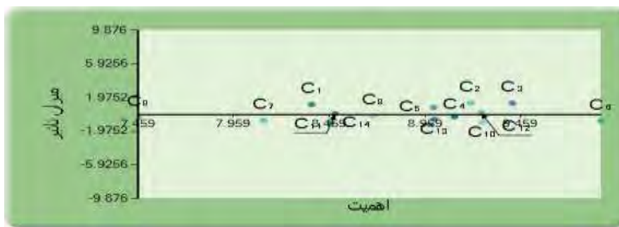
شکل ۲- نمودار IRM