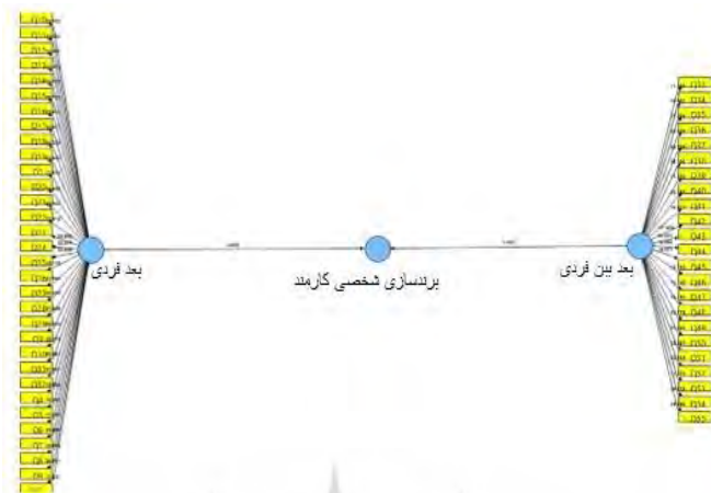
شکل ۲. مدل تحقیق در حالت معناداری

در ادامه ضرایب مسیر و مقادیر معناداری متغیرهای تحقیق در جدول ۶ ذکر شده است.