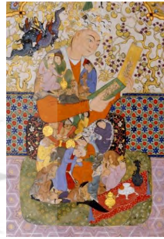
تصویر ۱. جوان با لباس ترکیبی در حال مطالعه، ایران، سده ۱۷م. موزه لوور