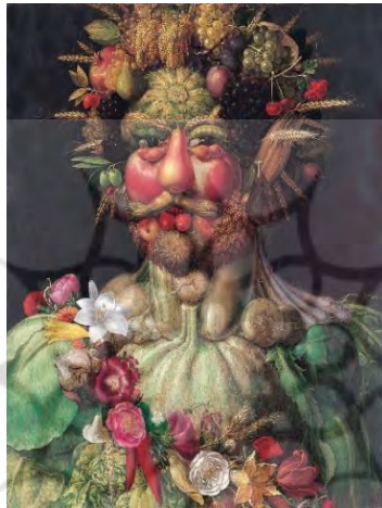
تصویر ۲. خدای فصول، اثر آرچیمیلدو، سده ۱۶م. قلعه اسککستر، سوئد (Kriegeskorte, 2000).