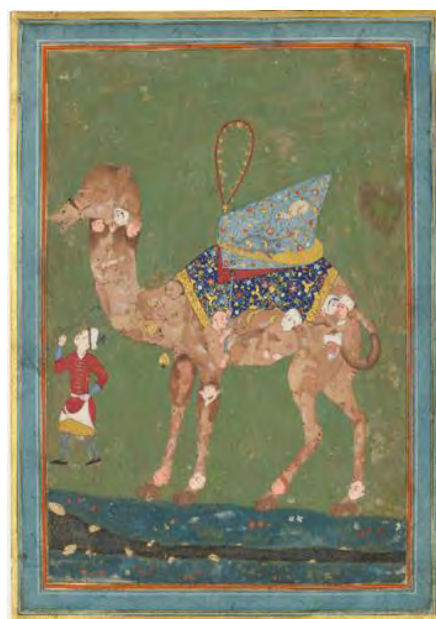
تصویر ۴. شتر ترکیبی، اواخر سده ۱۶م، موزه متروپولیتن (تارنمای موزه متروپولیتن، ۲۰۱۷)