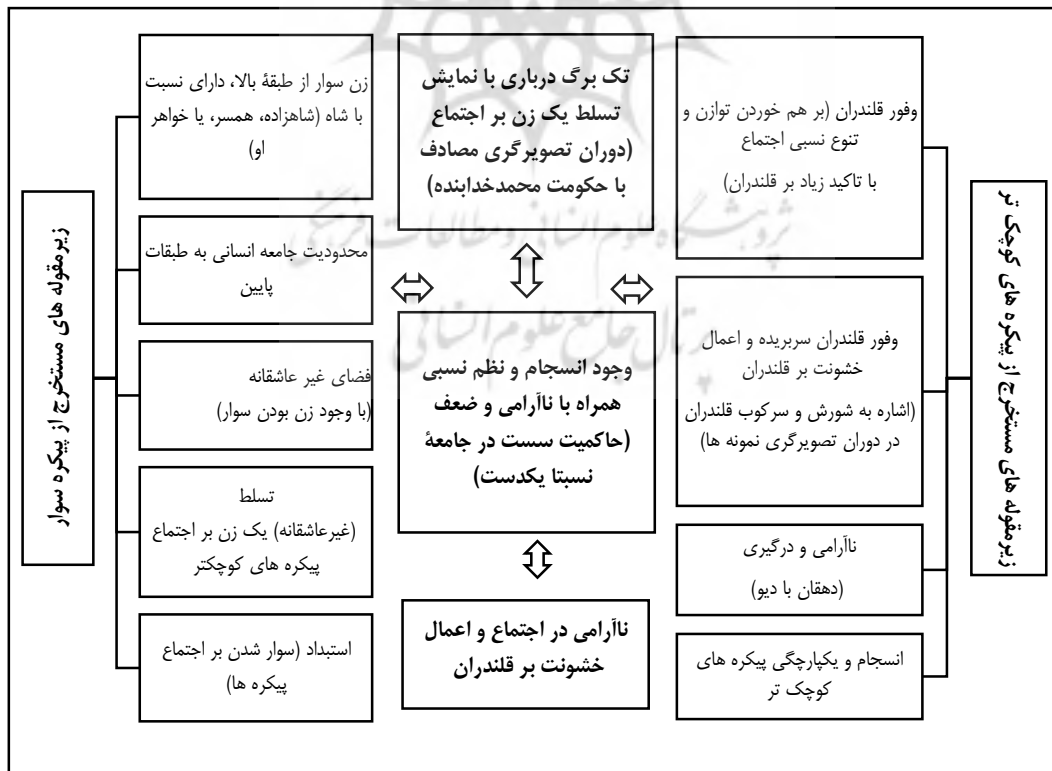
شکل ۱. مقوله‌های مستخرج از تحلیل محتوای نقاشی زن سوار بر مرکب ترکیبی صفوی اواخر سده ۱۰۵۰ ق/ ۱۶م.