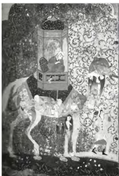
تصویر ۵. زن سوار بر شتر ترکیبی، اواخر سده ۱۶م (تارنمای موزه کلیولند، ۲۰۱۹)