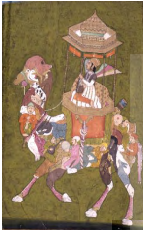
تصویر ۳. سوار بر شتر ترکیبی، هند، قرن ۱۸م. موزه بریتانیا (تارنمای موزه بریتانیا، ۲۰۱۱)

عنوان "نقاشی ترکیبی" عمدتاً برای آثاری به کار می‌رود که در آن‌ها موجود و یا پیکره‌ای بزرگ‌تر از ترکیب موجودات و یا عناصری کوچک‌تر پدید آمده‌است. نگاره‌های ترکیبی صفوی نیز دسته‌ای از نقاشی‌های ترکیبی به‌شمار می‌روند و اغلب در زمرهٔ تک‌برگ‌ها قرار می‌گیرند. اولین نمونه‌های برجای مانده از این آثار به اواخر سده ۱۰هـ. ق/ ۱۶م. بازمی‌گردد و بجز ایران در مناطق دیگری چون ایتالیا و هند نیز قابل مشاهده است. تصویرگری نمونه‌های ترکیبی در ایران صفوی سده‌های ۱۶ و ۱۷ م. رواج بسیار دارد و در نمونه‌های متنوعی چون مرد سوار بر مرکب (اسب، فیل) ترکیبی، زن سوار بر مرکب (عمدتاً شتر) ترکیبی و مرکب (اسب، شتر) ترکیبی و مرد و زن با لباس ترکیبی قابل مشاهده است. پژوهش پیش رو می‌کوشد با رویکرد تاریخ اجتماعی و تأکید بر بازتاب جامعه در اثر هنری، نقش و جایگاه زنان را در نمونه‌ای از این آثار با عنوان "زن سوار بر شتر ترکیبی" (۱۵۷۰-۱۵۸۰م.) تبیین نماید. این اثر، یکی از متقدم‌ترین نمونه‌های برجای مانده از نقاشی‌های ترکیبی صفوی است که زنی را سوار بر اجتماعی از پیکره‌های کوچک‌تر به تصویر می‌کشد. در این راستا، پرسش‌های اساسی که این تحقیق بر پایه آن‌ها شکل گرفته بدین قرار است: نقش و جایگاه زنان در تکوین اجتماع ترسیم شده در اثر "زن سوار بر مرکب ترکیبی" اواخر سده ۱۰هـ. ق/ ۱۶م. صفوی چیست؟ نقش و جایگاه زنان ترسیم شده (به‌ویژه زن سوار) در این اثر چگونه بازتابی از تاریخ اجتماعی و جامعهٔ هم‌زمان با تصویرگری این آثار است؟