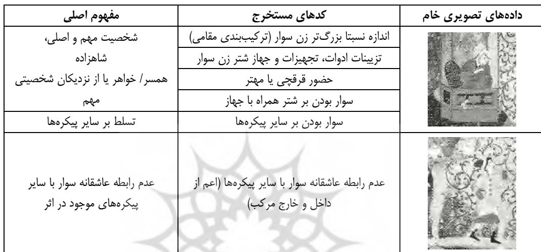
جدول ۵. نمونه کدگذاری و مفهوم‌یابی از داده‌های تصویری (پیکره خارج از مرکب)

حضور زن سوار توجه بیشتر به بررسی احتمال وجود فضای تغزلی و عاشقانه در تصویر را ایجاد می‌کند؛ با این همه فضای تصویر حاکی از عدم نمایش هر گونه فضای عاشقانه است؛ نه تنها هیچ پیکره‌ای زن سوار را همراهی نمی‌کند بلکه میان هیچ‌یک از پیکره‌های کوچک‌تر نیز کدهایی مانند زوج‌هایی در آغوش یکدیگر، زوج‌هایی در حال شراب خوردن و مانند آن (مشابه کدهای موجود در تصاویر زن سوار بر مرکب ترکیبی اواخر سده ۱۷م.) که به روابطی بیانگر حاکمیت فضای عاشقانه بر نگاره بیانجامد، مشاهده نمی‌شود. بر این اساس زن سوار تسلطی غیرعاشقانه بر اجتماع پیکره‌های کوچک‌تر دارد که این سلطه مانند نمونه‌های مرد سوار بر مرکب ترکیبی حاکی از استبداد سوار و البته به دلیل فراوانی قلندران و درگیری میان پیکره‌ها همراه با نوعی فضای خشونت‌بار و عدم توازن نسبی به نظر می‌رسد. براساس موارد یادشده، زیرمقوله‌های برآمده از بررسی تمامی پیکره‌ها و فضای کلی اثر در جدول ۶ قابل بازبایی است.