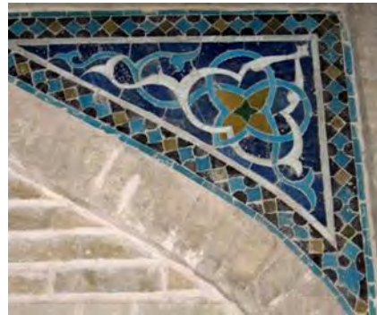
تصویر ۵- کاشی معرق، نقش اسلیمی، راهرو ورودی مسجد- مدرسه امامیه، نگارنده