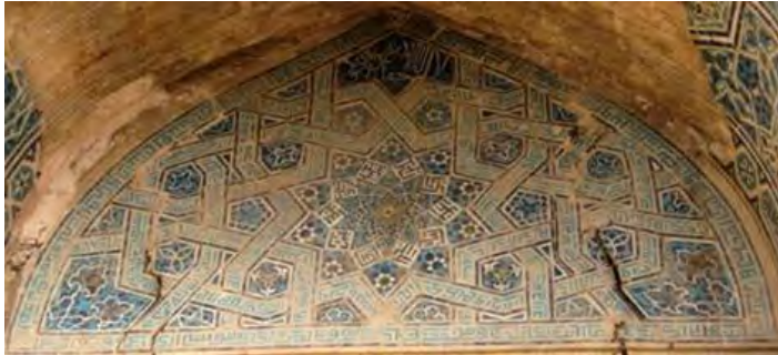
تصویر- ۱۳ کتیبه کاشی‌کاری، اسامی اصحاب حدیث «عشره مبشره» در وسط و صلوات بر حضرت محمد (ص) و ائمه اطهار در حاشیه، ایوان شمالی مسجد- مدرسه امامیه اصفهان، نگارنده

هفت رنگ اجرا شده‌اند؛ و با توجه به این که تکنیک کاشی‌کاری هفت رنگ، شیوه ابداعی در دوره صفوی و رسمی شدن مذهب تشیع، در این دوره در ایران است؛ احتمالاً در بازسازیها و مرمت مدرسه امامیه در دوره صفویه یا قاجار به بنا الحاق شده است، که متأسفانه تاریخ یا سند مکتوبی پیرامون این مسئله در دست نیست (تصویر ۱۱).