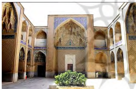
تصویر ۲- نمای حیاط و ایوانهای مسجد امامیه، (نگارنده)

ماهیت و زیبایی تزیینات کاشی کاری هر بنا به معیارهای گوناگونی چون متن و محتوا، نوع نقش و خطوط، ترکیب و تناسب، نوع کاشی و اجرای دقیق تزیینات بستگی دارد. مسجد- مدرسه امامیه دارای انواع تزیینات کاشی کاری است که عمده آن‌ها بین سالهای ۷۵۵ ه.ق تا ۷۵۸ ه.ق در زمان آل مظفر، همزمان با ساختمان صفا عمر در مسجد جامع اصفهان انجام شده است (گدار، ۱۳۷۵: ۴۳۹). در پژوهش حاضر با توجه به ابعاد ساختار تزیینات کاشی کاری مدرسه امامیه، این تزیینات بر اساس معیارها و شاخصه‌های فوق مورد بررسی و گونه‌شناسی قرار گرفته است.