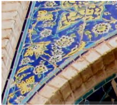
تصویر ۶- کاشی هفت رنگ، نقوش ختایی، ایوان جنوب قی، شرقی مسجد- مدرسه امامیه، نگارنده

در تزئینات کاشی‌کاری مدرسه امامیه، سه رنگ لاجورد، فیروزه ابی و سفید در کنار رنگ آجری بنا بیشترین حضور را دارند که معمولاً رنگ تیره لاجورد، به عنوان زمینه و دورنگ سفید و فیروزه‌ایی به صورت متن و نوشته‌ها استفاده شده و این تضاد رنگی موجب جذابیت و هماهنگی تزئینات شده است. علاوه بر رنگ‌های مذکور، رنگ‌های سبز، آکر و قهوه‌ایی تیره متمایل به مشکی هم در این کاشیکاری‌ها دیده می‌شود که بیشتر در کاشی‌ها با نقوش هندسی استفاده شده‌اند.