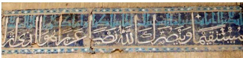
تصویر ۱۲ کتیبه کاشی‌کاری زوجی، با خط ثلث در پایین و خط کوفی در بالا، ایوان شمالی مسجد-مدرسه امامیه اصفهان، (نگارنده)