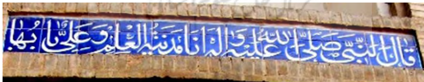
تصویر ۱۱- کتیبه کاشی‌کاری با خط ثلث، ایوان شمال شرقی مسجد-مدرسه امامیه اصفهان، (نگارنده)

علاوه بر کتیبه‌های ثلث نویسی شده، بخش عمده‌ایی از کتیبه‌های مسجد-مدرسه امامیه با خط کوفی بنایی اجرا شده‌اند. کوفی بنایی، خطی با ساختار هندسی است که حروف و کلمات در کشیدگی و چرخش و اندازه، انعطاف‌پذیری زیادی دارند (مکی‌نژاد، ۱۳۸۶: ۸۸) و از نظر اجرا از جمله خطوط دشوار به شمار می‌آید. کتیبه‌های بنایی مدرسه امامیه فراگیر بوده و در بخش‌های داخلی و نمای خارجی بنا، در کادرهای هندسی مربع، لوزی و شمشه، یا دو شیوه اجرا شده‌اند؛ یکی به شیوه معرق با دو رنگ سفید و لاجورد (تصویر ۷) و دیگری با تکنیک معقلی و تلفیقی از کاشی‌های مربعی شکل تکرنگ (لاجورد یا فیروزه‌ای) در بستری آجری. (تصویر ۸) (جدول ۲)