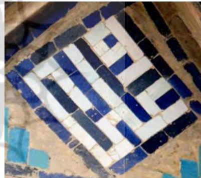
تصویر ۷- کاشی معقلی با خط بنایی، کاشی، ایوان جنوب شرقی مسجد- مدرسه امامیه، (نگارنده)