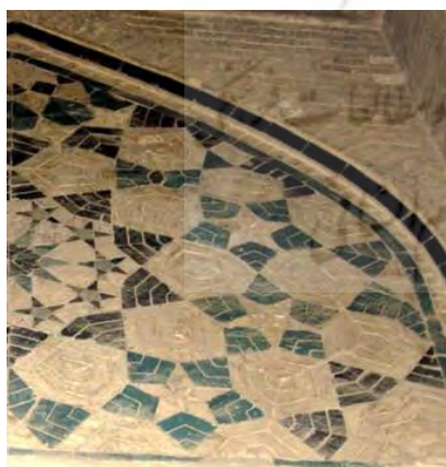
تصویر ۱۰- کاشی‌کاری با نقش هندسی گره کند دو پنج، مسجد-مدرسه امامیه اصفهان، (نگارنده)

در ساخت بناها، بهره‌گیری از قواعد هندسی، از عوامل تاثیرگذار در ایجاد وحدت بین فضای معماری و تزیینات به کار رفته آن به شمار می‌آید. این امر در نقوش تزیینات کاشی‌کاری مسجد- مدرسه امامیه هم قابل مشاهده است. این دسته از نقوش در قالب چند وجهی‌های منتظم لوزی، مربع و مستطیل شکل و گره‌های هندسی که شبکه‌ایی از آمیزش چند وجهی‌های منتظم و غیر منتظم است، با استفاده از کاشی یا ترکیب کاشی با آجر، در این بنا به اجرا درآمده‌اند. گره «تند ده» و گره «کند دو پنج» از جمله گره‌های هندسی است که در تزیینات کاشی‌کاری مسجد-مدرسه امامیه به وفور دیده می‌شود. (تصاویر- ۹ و ۱۰) (جدول ۲)