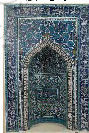
تصویر ۳- محراب کاشی کاری مسجد- مدرسه امامیه، موزه وپلین متروپلیتن نیویورک، (URL:1)