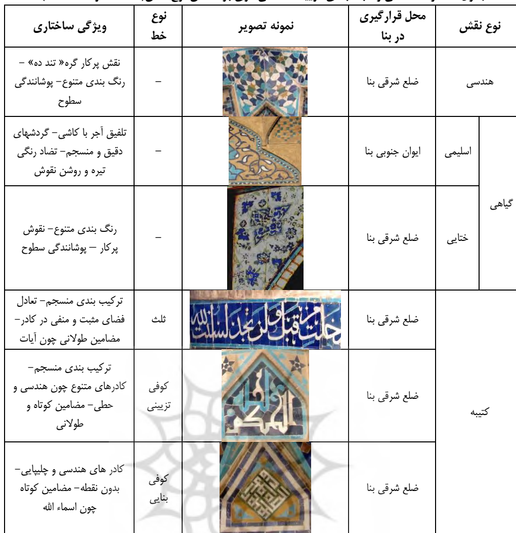
جدول ۲- گونه شناسی و طبقه بندی تزیینات کاشی کاری بر اساس نوع نقش