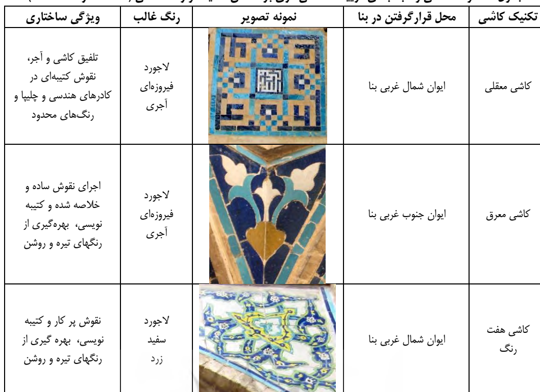
جدول ۱- گونه‌شناسی و طبقه‌بندی تزیینات کاشی‌کاری بر اساس تکنیک و رنگ کاشی (ماخذ: نگارنده، ۱۳۹۹)