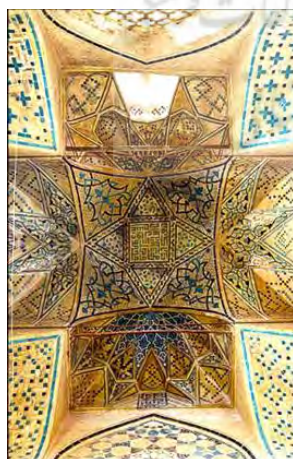
تصویر ۴- نمای زیر گنبد مسجد- مدرسه امامیه، صلع جنوبی، (نگارنده)