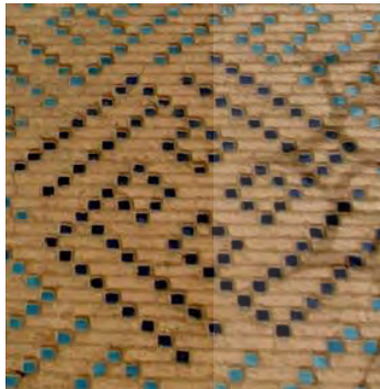
تصویر ۸- کاشی معقلی با خط بنایی، تلفیق آجر و کاشی، ایوان ایوان شمالی مسجد- مدرسه امامیه، (نگارنده)