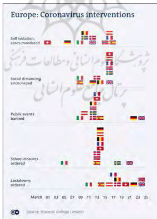
شکل ۱: مداخلات مرتبط با ویروس کرونا در اروپا

یکی از مهم‌ترین اقدامات در حوزه کنترل ویروس کرونا، قطع کردن زنجیره انسانی سرایت آن است. از این‌رو، شاهد آن هستیم که اغلب کشورهای سیاست قرنطینه را در سطوح گوناگون در پیش گرفته‌اند. شکل ۱ سطوح متفاوت قرنطینه به‌منظور کنترل سرایت ویروس کرونا در اروپا را نشان می‌دهد: قرنطینه خانگی،