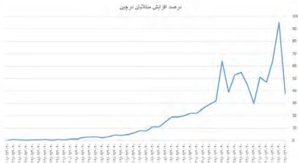
شکل ۲: درصد افزایش مبتلایان در چین؛ قبل و پس از اعمال سیاست‌ها

تکیه بر زیرساخت قدرتمند فناوری اطلاعات و ارتباطات و به‌کارگیری همه‌جانبه امکانات بالینی و پزشکی، سیاست فاصله‌گذاری هوشمند مبتنی بر الگوی اطلاعات باز، مشارکت عمومی و تست فراگیر را در پیش گرفت که بسیار موفق و کارآمد بود. بدین ترتیب که گذشته از کمینه‌شدن هزینه‌های کوتاهمدت و بلندمدت تحمیل شده به اقتصاد ملی، در رویکرد فاصله‌گذاری هوشمند، جریان باز کلان‌داده‌های مفید برای مدیریت بحران با مشارکت حداکثری شهروندان، به راهبردی قدرتمند در برابر شیوع ویروس کرونا در کره جنوبی تبدیل شد.