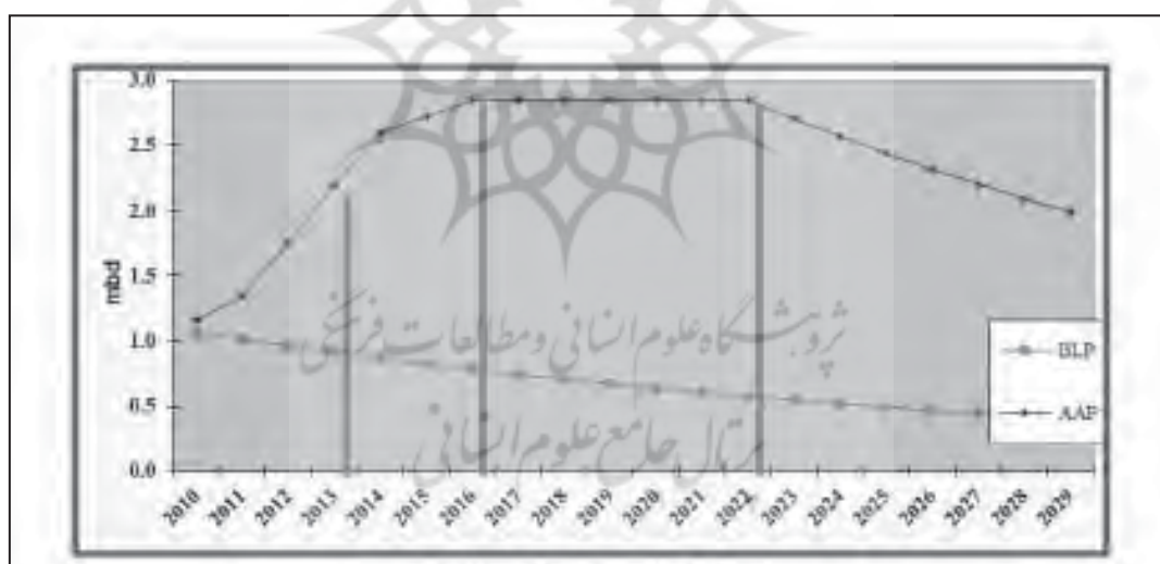
نمودار ۲: تولید واقعی و پایه میدان رمیله

برنامه تولید پایه ۱ (BLP): تولید پایه عبارتست از استمرار تولید فعلی میدان با یک نرخ کاهش تولید که در قرارداد مشخص می‌شود. این نرخ برای میدان رمیله ۵ درصد تعیین شده است. یک عامل