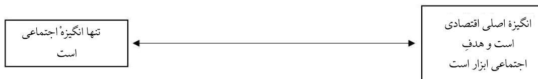
شکل ۱: طیف کارآفرینی اجتماعی (Peredo and McLean, 2006)

می‌کنند، درحالی‌که، کارآفرینان اجتماعی با رویکردهای کارآفرینانه بخش اجتماعی را متحول می‌کنند. قبلاً بیان شد تحول‌آفرینی یکی از جنبه‌های مهم کارآفرینی از دیدگاه شومپتر است؛