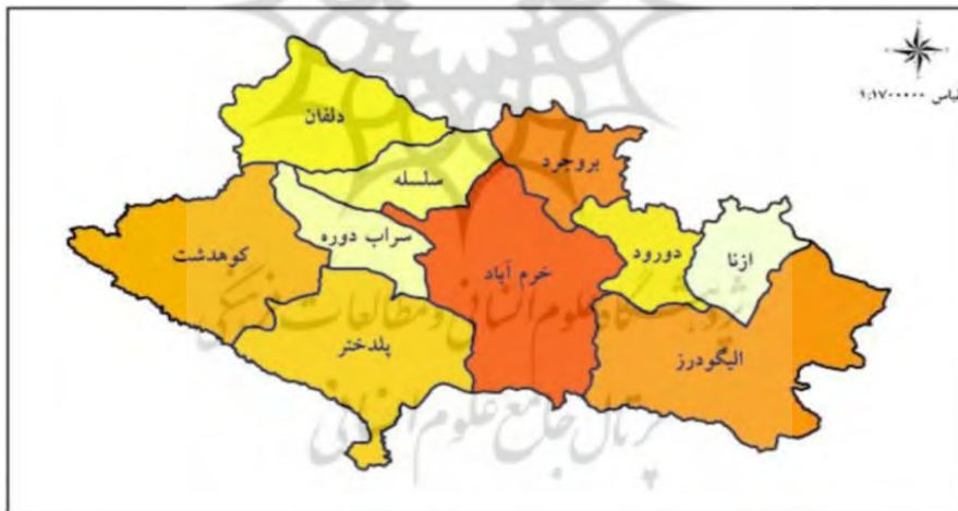
شکل ۳. نقشه موقعیت شهرستان های استان لرستان، منبع: مرکز آموزش و پژوهش های توسعه و آینده نگری استان لرستان، ۱۳۹۸

جمع آوری اطلاعات و داده های تحقیق از اطلاعات بررسی شده وقوع جرایم از رده های متولی سیستم انتظامی استان استفاده شده است. این تحقیق به منظور شناسایی رابطه شاخص های توسعه اجتماعی- اقتصادی با جرم سرقت در سطح شهرستان های استان لرستان با استفاده از روش معادلات ساختاری با رویکرد حداقل مربعات جزئی (-PLS SEM) انجام یافته است. رویکرد حداقل مربعات جزئی، نسل دوم مدلسازی معادلات ساختاری یا رویکرد مبتنی بر واریانس برای تحلیل داده های جمع آوری شده فرآیندی مشابه ولی متفاوت با تکیه بر محدودیت های رویکرد مبتنی بر کواریانس است. توانایی این رویکرد در کار با داده های اندک، عدم حساسیت به نرمال بودن داده ها، توانایی در پیش بینی و پشتیبانی از مدل های بسیار پیچیده و همچنین قابلیت مدل اندازه گیری ترکیبی و انعکاسی است (کلانتری، ۱۳۸۸: ۱۲). شکل ۲، نیز متغیرهای تحقیق را نشان می دهد.