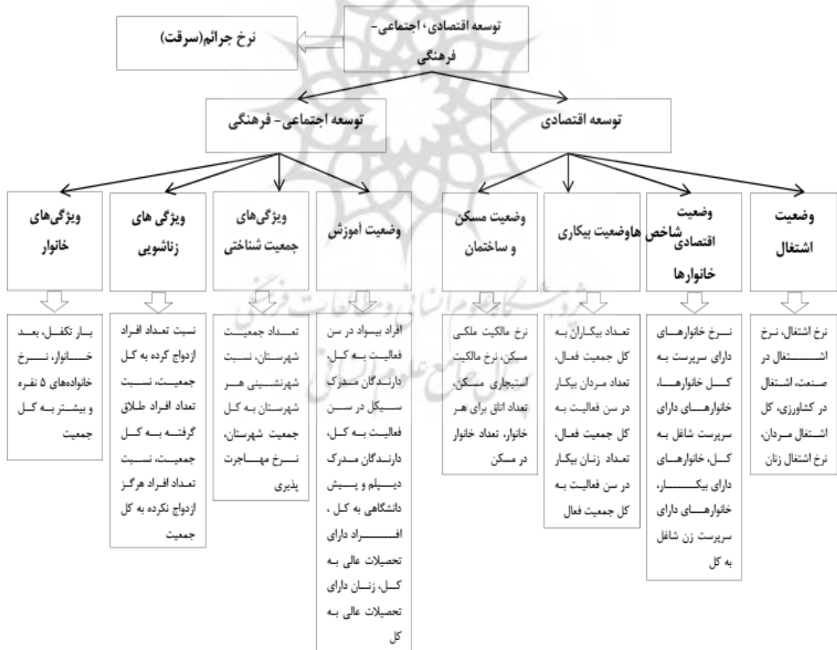
شکل ۲. مدل عملیاتی و متغیرهای پژوهش، منبع: نگارندگان، ۱۳۹۸

آمار ایران، پایان نامه ها، طرح های پژوهشی و سایر اسناد و مدارک اعم از فارسی و انگلیسی است. از سوی دیگر برای